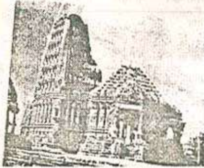
आकृती १ भूमिज प्रासाद

असेल तर प्रासाद अनुक्रमे समांग व नवांग प्रकारचा असतो. इ) शिखराच्या प्रत्येक वाजूवर उत्कृष्ट नक्षीकाम केलेली लता असते. ई) वरती घंटाकृती शिखर असते. उदा. सित्रर येथील गोंडेश्वराचे (गोविंदेश्वराचे) देवालय; अंबरनाथ येथील शिवालय.