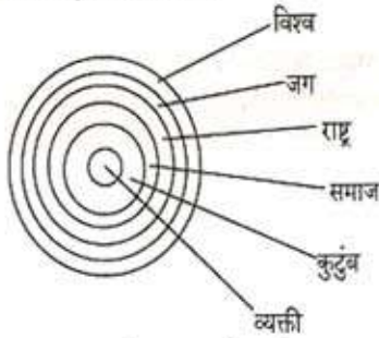
आकृती क्र. १ व्यक्ती आणि जग

मी आणि आपण सर्वजण एक व्यक्ती म्हणून एका कुटुंबाचे घटक आहोत. अशी अनेक कुटुंबे मिळून एक समाज बनतो. मग त्याला आपलं गाव म्हणू या, ज्ञाती म्हणू या, सहकारी गृह वसाहत किंवा एखाद्या मोठ्या शहराचे एक उपनगर म्हणू या.