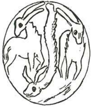
Dragon seal from Lothal Gujrat depicting the Vritra myth (Joshi and Parpola 1987 : 268 L 123)

वृत्रवधकथेची दोन रुपांतरे, महाभुजङ्ग आणि सर्वमानव ब्राह्मण ग्रंथामध्ये वर्णन केली आहेत. ती दोन्ही मध्यपूर्वेत तसेच मध्य एशिया येथील उत्खननात मिळाली आहेत. लोथल येथे सापडलेल्या गोल मुद्रेवर (आ. क्र. १) वृत्रवध कथेचे मिथ्य कोरले आहे. (Joshi and