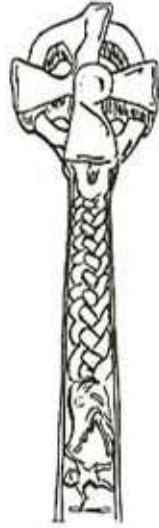
Fig 5. Thunor fighting the world serpent - Scene from the upper part of Gosforth Cross. (Branstonr 1974 : 118)

वृत्रवधकथेचा प्रचार अनेक शतके होत होता. अगदी इ. स. ११ व्या शतकापर्यंत सुद्धा हे मिथ्य कोरले जात असे. हिटाइट पर्जन्य देवता महाकाय भुजङ्गाला मारत असल्याचे एक शिल्प ह्या मिथ्याचा पाश्चात्य देशातील प्रसार दाखविते (आ. क्र. ४) (Branstone 1957 : 117) युरोपात ख्रिश्चन धर्ममताने आपले वस्तान बसविल्या- नंतरही जनमानसातून ह्या मिथ्याचा लोप झाला नाही. गोसफॉर्थ येथे मिळालेल्या दगडी कूसाच्या दांड्यावरही भुजङ्ग मिथ्याचे चित्रण आढळते ब्रान्स्टोन यांनी या चित्रांचे विश्लेषण करतांना इन्द्राचा निर्देश केला आहे. तसेच युरोपातील धुनर देवाच्या मिथ्यकथेचा निर्देश करून त्याच्या आकृतीचे साम्य हिन्दू, हिटाइट आणि उत्तर युरोपातील नॉर्स देवाशी दाखविले आहे. (Branstone 1974:118) त्याच्या हातात महाकाय हातोडा असून त्याच्यासह दुसरी देवताही तेथे आहे. देवता द्वयांनी-इंद्र-अग्नि, इंद्र-सोम इत्यादी, वृत्रवध केल्याचे निर्देश ऋग्वेदात आले आहेत. क्र. ८.४०.८, ८.१००.१२, ९.६१.२० इत्यादी. पाश्चात्य देशांमध्ये इ.स. च्या ९व्या शतकापर्यंत म्हणजे ख्रिश्चन धर्माचा प्रसार सुरू झाल्यावरही कित्येक शतके ह्या कथेचा धार्मिक प्रभाव टिकून होता. त्याचा हा कूस उघड पुरावा आहे. इंग्लंड मध्ये सॅक्सन जनसमूहात ही कथा प्रचलित होती. आ. क्र. ५.