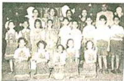
'ऐरा गैरा नथू खैरा' यातील कलाकार मागंदशंक शिक्षकांसह

जानेवारी ७ व ८ रोजी या शाळेचे स्नेहसंमेलन संपन्न झाले. या कार्यक्रमांतील वैशिष्ट्य म्हणजे भारतीय पारंपरिक नृत्य गायनापासून ते पाश्चात्य नृत्यापर्यंतच्या सुंदर मिलाप या संमेलनात होता.