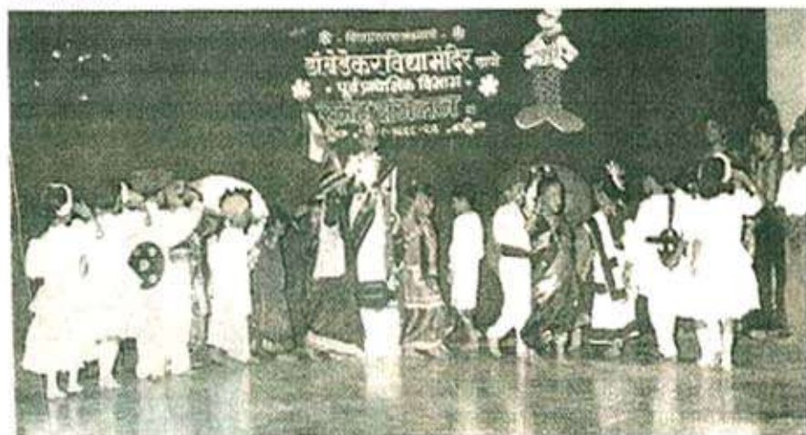
नृत्य सादर करणारी छोटी कलाकार मंडळी

तर मोठ्या शिशुचे चार कार्यक्रम झाले. छान छान बाग, जाऊ कशी मी नोकरीला, चॉकलेटचा राजा, हाकरे होडी होडी, संत मेळा, शेतकरी नृत्य, टप-टप टिपरी या सर्व कार्यक्रमांतील निरागस बालकांचा अभिनय, पोपाख व संयोजन वाखाणण्या सारखे होते. अर्थातच हे नाच बसविण्यासाठी शिक्षिकांनी घेतलेली अपार मेहनत विशेष उल्लेखनीय आहे.