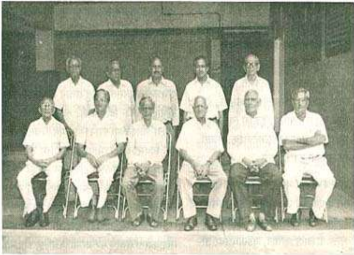
कार्यकारिणी मंडळ - विद्या प्रसारक मंडळ १९९९ - २०००

ऑगस्ट १९ च्या अंकांमध्ये विद्या प्रसारक मंडळाच्या १९९९ - २००० वर्षांसाठी निवडण्यात आलेल्या कार्यकारिणीच्या सदस्यांची नावे फोटोसह दिली होती. त्यांत उभ्या असलेल्या सभासदांच्या नावांमध्ये चूक झाली. त्याबद्दल दिलगिरी व्यक्त करून कार्यकारिणीचा तोच फोटो परत छापत आहोत. झालेल्या चुकीबद्दल क्षमस्व ! - संपादक