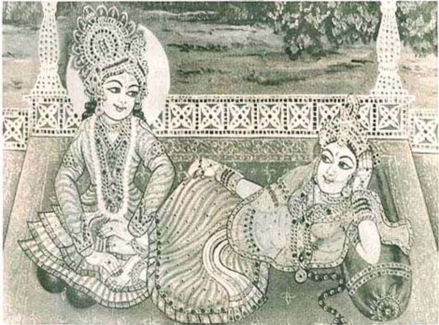
पुरातन वास्तू- वाडे मंदिरे यांतील ही भिंती चित्र.

'सूर्यकिरण', हाऊ. सो. नोपाडा, ठाणे २ दूरध्वनी : ५४० ०२२२