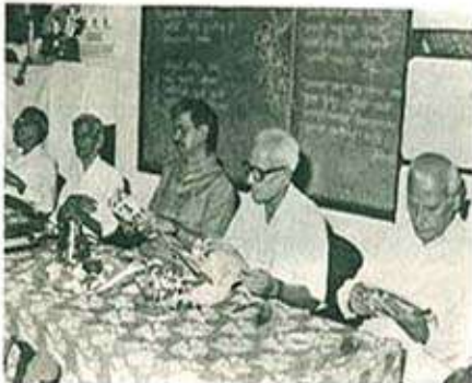
सौ. ए.के.जोशी स्कूल 'रोशनी' मासिकाचे प्रकाशन