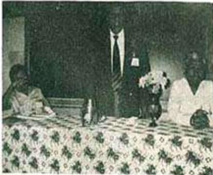
V.P.M. Institute of Management Studies, Thane