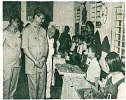
सौ. ए.के.जोशी स्कूल - प्रथमिक विभाग प्रदर्शन