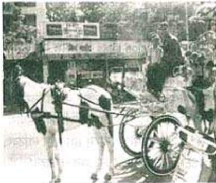
टांग्यात मजा करताना लहान मुले.

शुक्रवार दिनांक २२-३-२००२ रोजी पूर्व प्राथमिक विभागातील मोठा शिशु वर्गाला आगळावेगळा निरोप समारंभ देण्यात आला. निरोप समारंभ शाळेत साजरा न करता या दिवशी २७६ मुलांना मासुंदा तलावपाळी येथे दुपारी २.३० वाजता नेले. त्यानंतर मुलांना सजवलेल्या वगांत वसवून मासुंदा तलावाला पूर्ण फेरी केली.