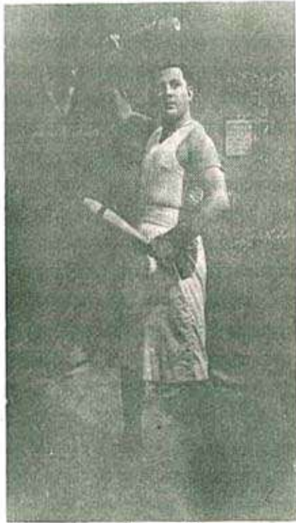
'ब्रह्मचारी' - मास्टर विनायक

भारताला स्वातंत्र्य मिळाल्यावर महाराष्ट्र राज्य निर्मितीनंतर मराठी बोलपटांना भरभराटीचा काळ येईल