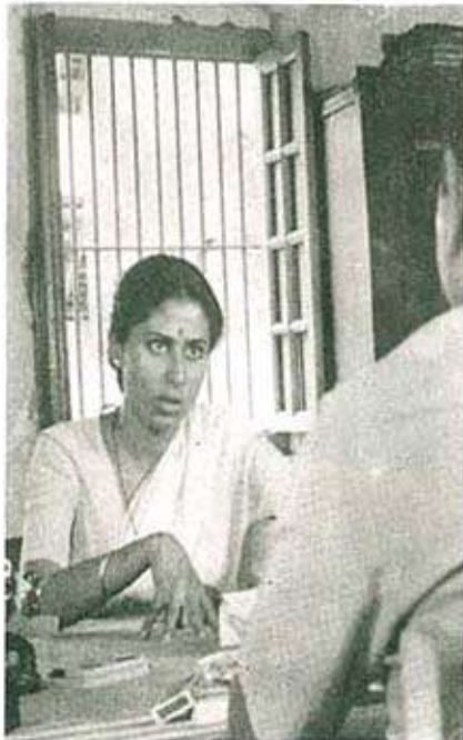
'उंबरठा' - स्मिता पाटील

६ फेब्रुवारी १९३२ रोजी मॅजेस्टिक सिनेमात