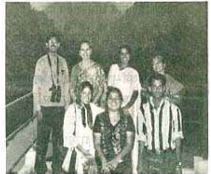
रेणुकाजी संक्युरीतील एक छायाचित्र

२८ ऑक्टोबरला रात्री ११ वाजता दादर-अमृतसर-दादर या गाडीने सहलीची सुरुवात झाली. आम्ही ३० ऑक्टोबरला सकाळी ९.३० वाजता अंबाल्याला पोहोचलो. येथून आम्ही रेणुकाजीसाठी रवाना झालो.