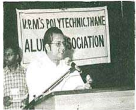
माजी विद्यार्थी संवाद साधताना