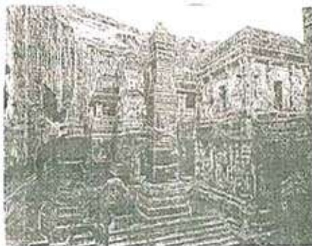
कैलास मंदिर, वेरूळ

नव्हे, एक भला मोठा एकसंध प्रस्तर कोरून त्याला मंदिर स्थापत्याचे रूप आणलेले आहे. डोंगरातील एका प्रचंड खडकावर कोरीव काम करून मुख्य मंदिर, त्याचे सभामंडप, स्तंभयुक्त नंदीमंडप, अलंकृत भव्य द्वारमंडप हे सर्व भाग बनवण्यात आले आहेत. एवढ्या प्रचंड प्रमाणावरील हे कोरीव काम करण्यास लागणारा काळ, श्रम आणि पैसा याविषयी कल्पनाच केलेली बरी. मंदिरातील व बाहेरचे सुटे स्तंभ, समोरील हर्तीची शिल्पे इत्यादींसाठी आवश्यक असणारा सर्व भाग कायम ठेवून बाकी दगड फोडला जाणे आवश्यक होते. पूर्वं नियोजनाशिवाय हे शक्य नाही. मंदिराच्या मुख्य इमारतींना व सभोवतालच्या लहान सहान मंदिरांना जोडणारे पुलासारखे मार्ग पहिल्यापासून शाबूत ठेवणे आवश्यक होते. या पद्धतीचा एक दोष म्हणजे संपूर्ण मंदिर अत्यंत भव्य असूनही एका खोल खड्ड्यात असल्यामुळे ब्राहेरून व लांबून त्याचे ऐश्वर्य लक्षात येत नाही. यावर उपाय म्हणून तेथील वास्तुविशारदांनी त्याच्या पायाचा चवुतरा खूप उंचीचा ठेवला आहे. हे शैवमंदिर असून गर्भगृहात एक भव्य शिवलिंग आहे. शिवाचे निवासस्थान असलेल्या कैलास पर्वताची ही प्रतिकृती