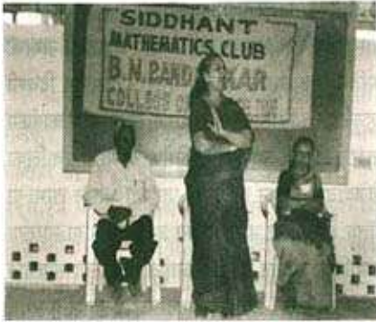
Math Exhibition on 20th December 2004 B.N. Bandodkar College of Science, Thane

डॉ. श्रीनिवास रामानुजन जयंती प्रीत्यर्थ वा.ना.बांदोडकर विज्ञान महाविद्यालयातील गणित मंडळ (सिद्धांत) तर्फे २० डिसेंबर २००४ रोजी गणित प्रदर्शनाचे आयोजन करण्यात आले.