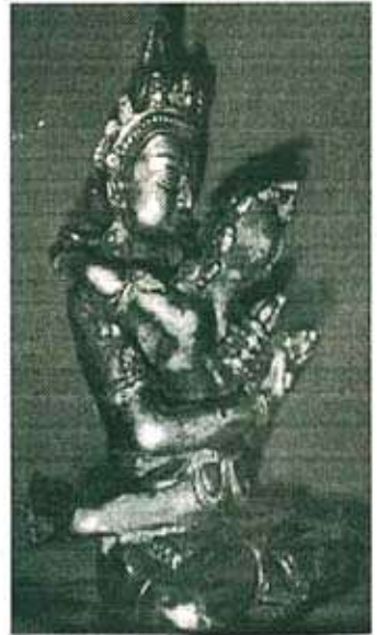
(स्त्री-पुरुष वैश्विक रूप)

मला जाणीव आहे की हे दोन्ही संस्कार जे स्त्री-पुरुष संबंधात आहेत, त्यांचे कर्मकांड, मंत्र, विधी मी या छोट्याशा लेखात संपूर्णपणे उभे करू शकणार नाही!! उलट, मला आपल्याला या कर्मकांडाच्या स्वरूपात हिंदू वैदिक धर्मातील शास्त्राच्या मूळ आधाराकडे आपल्याला न्यावयाचे आहे. कारण, हे विधी काही कवी कल्पना नव्हते तर सामान्य स्त्री-पुरुषांना त्यांच्या प्राणीसदृश्य वैषयिक किंवा केवळ सामाजिक उपचार ह्या पातळीवरून स्त्री-पुरुष यांच्या वैश्विक मूळ स्वरूपात ह्या नात्याची, लिंगभेदाची व जैविक उत्क्रांती उद्दिष्टाची काय निसर्गयोजना किंवा ईश्वरयोजना आहे त्या भूमिकेपर्यंत न्यावयाचे आहे. ह्या कर्मकांडात फक्त त्या तत्त्वाची आरशातील थोडाशी अस्पष्ट प्रतिमाच दिसले. प्रत्यक्ष 'अनुभूती' ही स्त्री-पुरुषांच्या क्षमतेवर व समाजाच्या आध्यात्मिक क्षमतेवर अवलंबून राहिल.