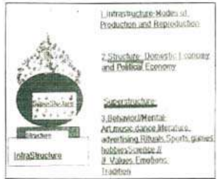
चित्र नं. २

झाल्या आहेत, तरी देखील आजच्या राजकीय, सामाजिक, सांस्कृतिक, शैक्षणिक प्रचलित पद्धती ह्याच विश्वासावर आधारलेल्या दिसतील. मारविन हॉरिस ह्यांच्या सांस्कृतिक भौतिकवादाचा आधारस्तंभ हा कार्ल मार्क्सच्या "इंफ्रास्ट्रक्चर, स्ट्रक्चर व सुपरस्ट्रक्चर" ह्या सिद्धांतावर आधारलेला आहे. ह्याचे चित्रमय स्वरूप सोवत छापले आहे. ह्यात आणखी एक वारकावा सांगावाच लागेल.