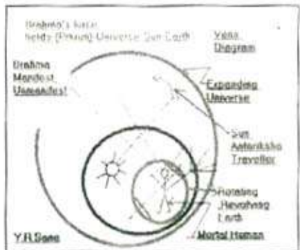
चित्र नं. ४

पृथ्वीवरच्या अस्तित्वाचा, आगमनाचा व निर्वाणाचा अर्थ जोपर्यंत निश्चित होत नाही तोपर्यंत समाजशास्त्राचा विचार हा अपूर्ण व तोकडा आणि दिशाहीन, अव्यक्त व भरकटणारा असाच असणार व रहाणार हे निश्चित. त्याची थोडी कल्पना "Life's Journey" ह्या चित्रावरून यावी. ह्या पृथ्वीच्या 'प्लॅटफॉर्मवर' सतत नवीन जीवांचे आगमन-जन्म व जबळजबळ १०० वर्षांच्या वास्तव्यानंतर बहिर्गमन होते ही परिस्थिती सतत डोळ्यासमोर ठेवली पाहिजे. अशा ह्या 'Temporary' अल्पकालीन वास्तव्याचाच एक "तात्पुरता समाज" बनत असतो व आपल्याला ह्या समाजाच्या संस्कारांचा, मूल्यांचा संस्कृतीचा अभ्यास अभिप्रेत आहे.