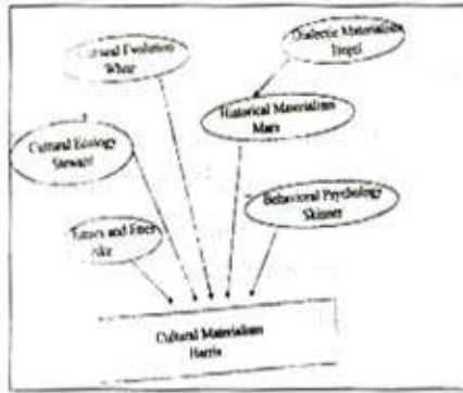
चित्र नं. १

हे चित्र काय दर्शविते? मिस्टर मारविन हॅरिस ह्यांच्या प्रसिध्द 'सांस्कृतिक भौतिकवाद' ह्या 'तत्त्वज्ञान' ह्या स्वरूपाच्या निष्कर्षांपर्यंत नेणाऱ्या समाजातील निरनिराळ्या पंडितांच्या किंवा विचारवंतांच्या संस्कृतीच्या घडणीबद्दल, कार्यकारण सूत्रांबद्दल मांडलेल्या विशेष अशा