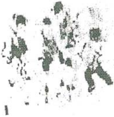
"Gang of Four" Chinese Cartoon चित्र नं. ४

पार्टी काँग्रेस ऑगस्ट १९७७ मधल्या सांस्कृतिक ठरावानंतर संपुष्टात आला. जर्मनी व चीन ह्या दोन देशांतील आधुनिक निरीक्षरवादी राज्यकर्त्यांनी जो नवीन सांस्कृतिक मूलभूत प्रयोग आपल्या समाजावर केला, त्याचे सूत्र काय होते ?