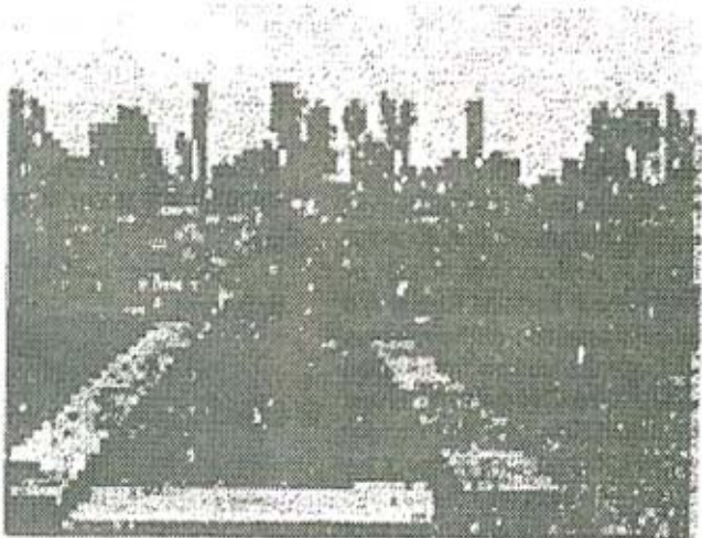
चित्र नं. २ Gas Chamber

पण, विज्ञानाचे चुकीचे निष्कर्ष व संहारक वैज्ञानिक संशोधनाची जाणूनबुजुन निर्मिती (Germs warfare, Star wars वगैरे) ह्यामुळे झालेल्या अत्याचारांबद्दल मूग गिळून बसण्यात विचारवंत धन्यता मानतात. मग ते अश्या वैज्ञानिक गैरकृत्यांना 'pseudoscience' म्हणून संबोधतात व स्वतःला व वैज्ञानिक चुकांना व विज्ञानवादाला वाचवतात.