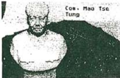
चित्र नं. ३

"To change the nature of the chinese people and to stave off the evils of Capitalism