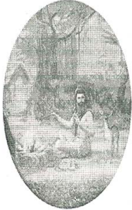
चित्र नं. २ : यज्ञ

१) भारतीय वैदिक संस्काराच्या प्रयोगांत 'अग्नि' व 'यज्ञ' ह्या दोन वैश्विक संकल्पना वा तत्त्वे आहेत व त्यांच्या आधारावर 'Rituals' 'धार्मिक रूढी प्रक्रिया' आचारल्या जातात. ह्या दोन्ही संकल्पना आजच्या समाजात अत्यंत विकृत, धूसर व अज्ञानी स्वरूपांत जाणल्या व राववल्या जातात. 'आध्यात्मिक जीवन दृष्टी' ही जवळ जवळ तडीपार केलेल्या अश्या आजकालच्या हिंदू समाजाला त्याच्या प्रचलित भौतिक विश्वासात ह्या संकल्पनांचा आध्यात्मिक व भौतिक, या दोन्हीचा, जो संयुक्त, एकात्म उद्देश, विनियोग व लाभ असतो, त्याची सूतराम जाणीव व ज्ञान दिसत नाही. ह्या संकल्पनांचे दिव्य, सत्य स्वरूप न समजल्याने हिंदू समाजाचा जो प्रचंड विश्वास व श्रद्धा, त्यांच्या ऋषी मुनी व परंपरा आचारधर्म ह्यावर मात्र आहे, त्याचा 'बाजारी फायदा' उठवण्यात सध्याच्या सगळ्या धर्मसंस्था व संप्रदाय मशगूल आहेत. त्यामुळे फुटबॉलच्या ऑलिंपिक मध्ये अर्जेंटिनाला यश मिळावे म्हणून 'यज्ञ, हवि व स्वाहाकार ! किंवा एखाधा भौतिकवादी राजकीय पुढान्याला 'सेक्यूलर पार्लिमेंटरी सिस्टिममध्ये' इलेक्शनमध्ये विजय मिळावा ह्या इच्छेने 'अर्ज' भरण्यापूर्वी (कामनापूर्ती साठी) केवळ शुष्क