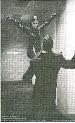
चित्र नं. ३

दुसरा चित्रपट म्हणजे 'Matrix' मॅट्रिक्स नावाची 'Trilogy' म्हणजे तीन भागांची सिरीयल. चित्र नं. ३ पहा.