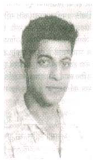
डॉ. गिरीश कर्नाड

आणि टेलिव्हिजन इंस्टिट्यूट, इंडिया चे डायरेक्टर व संगीत नाटक अकॅडेमी (India's National Academy of the Performing Arts) ह्या संस्थेचे चेअरमन होते.