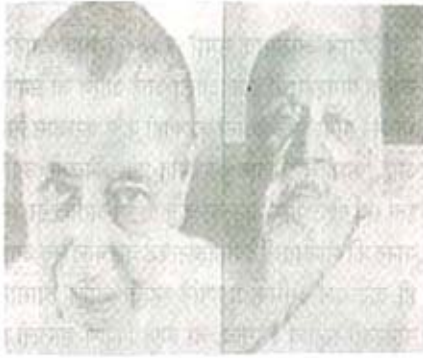
चित्र नं. १

पाँडिचेरी येथील श्री ऑरोविन्दो आश्रम म्हणजे श्री अरविदांच्या व माताजींच्या कल्पनांचे, आदर्शांचे आणि विचारांचे एक अत्यंत नैसर्गिक आणि वृद्धिंगत होणारे मूर्त स्वरूप.