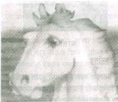
Haya Vadan - Dr. Girish Karnad

पण, डॉ. गिरीश कर्नाड यांच्याकडे ही सामर्थ्य आहेत याचा परिचय होईल. 'हयवदन' ह्याचा अर्थ घोड्याचा चेहरा. 'स्पिक्स' ह्या इजिप्तमधील शिल्पाचा जसा 'अर्ध पशू व अर्ध मानव' असा प्रत्यय त्याच्या रूपात व्यक्त झालेला सापडतो, तसाच प्रकार!! ह्यामध्ये गार्भितार्थ हा की सिंहाच्या धडावर मानवी मुख, हे जसे इजिप्तमधील शिल्प दाखवते, तसे मानवी धडावर 'घोडा म्हणजे अश्व' ह्याचे शिर दर्शवणे. हेच 'हयवदन'.