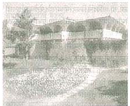
Last School, Pondicherry

श्री अरविद व माताजी दोघांनाही संस्कृत भाषेच्या श्रेष्ठत्वाची आणि वैशिष्ट्याची पूर्ण जाणीव होती. संस्कृत भाषेला राष्ट्रभाषेचा दर्जा मिळावा अशी इच्छाही त्यांनी व्यक्त केली होती. याच दृष्टिकोनातून येथील बालवर्गातील मुलांना छोटी छोटी संस्कृत वाक्ये बोलण्याची सवय केली जाते. आधुनिक काळात अनुसरून आता इथे संगणक शिक्षणाचीही सोय केली आहे. संस्थेचे ग्रंथालयही अतिशय सुंदर व भव्य आहे. अनेक भारतीय भाषांमधील व काही परकीय भाषांतील ग्रंथसंपदा इथे उपलब्ध आहे. श्री अरविद म्हणतात, "The new aim of education is to help the child to develop his intellectual, aesthetic, emotional, moral, spiritual being and his communal life and impulses out of his own temperament and being and to lead the child to discover for himself the aim of life in general, and the specific role that he himself has to play in life." अशा तऱ्हेच्या अत्यंत उदात्त आणि उच्च विचारांवर आधारलेल्या या शिक्षणसंस्थेचं कार्य गेली ५५ वर्षे चालू आहे.