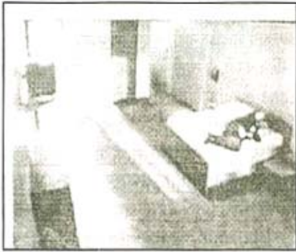
चित्र नं. ४

पण, ह्या किट्टीच्या सोदा किंवा 'डील' प्रकरणात गडबड होते आणि ही मुलगी अॅना ही रुम नं. १० मध्ये अभावितपणे शिरते, किट्टी वाहेरच रहाते, पण ती स्वतः नाहीशी होते.