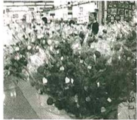
फ्लॉवर मार्केट मधील दृश्य

शोभेच्या वस्तू विक्रीसाठी ठेवलेल्या आहेत. त्यामध्ये कापडाच्या वस्तू, प्लॅस्टिकच्या वस्तू, वांबूपासून बनविलेल्या वस्तू अशा अनेक वस्तूंचा समावेश आहे. या सगळ्या वस्तू एवढ्या पद्धतशीरपणे लावून ठेवलेल्या आहेत की त्यांच्याकडे आपले लक्ष सहजच वेधले जाते. या दुकानातून देखील काहीना काही वस्तू खरेदी करूनच आपण बाहेर पडतो. तोच आपण धान्य आणि बियांच्या दुकानात प्रवेश करतो. आपल्याला एखाद्या धान्याचे किंवा फुलझाडाचे बी पाहिजे असेल तर ते येथे मिळते.