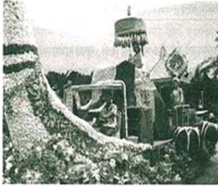
एक्सपो गार्डनमधील एक रथ

लक्ष वेधून घेतात. एक्सपो गार्डनमध्ये फेरफटका मारणे हा खरोखरच आनंद देणारा अनुभव आहे.