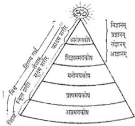
चित्र नं १

या जगात धडपडायला का आला, हे कोडे त्याला प्रथम (सहज) पडणार नाही व पडलेच तर उलगडणार तर