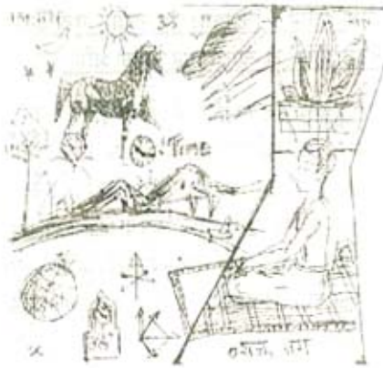
चित्र नं ३

आता प्रश्न पडेल की रूपका (Symbolism) चा उपद्रव्याप कशासाठी?