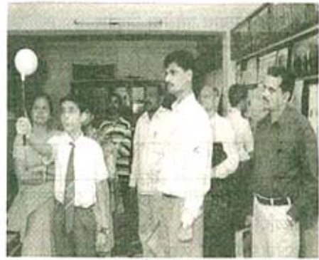
भूगोल विषयाची कार्यशाळा

• दि. २२ सप्टेंबर २००७ रोजी ठाणे बेथील सौ. आनंदीबाई केशव जोशी या शाळेत शिबिरातील शिक्षकांनी इ.३री ते ८वी च्या अभ्यासक्रमातील भूगोल अध्यापन या विषयावर कार्यशाळा आयोजित केली होती. या कार्यशाळेचा लाभ विविध नामवंत शाळांतील २७ शिक्षकांनी घेतला होता.