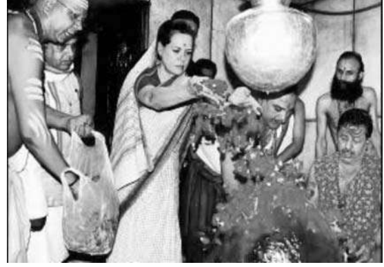
सोनिया गांधी - महाकाल मंदिर उज्जैन

म्हणूनच, मी आणखी दोन चित्रे दाखवून आपले लक्ष वेधू इच्छितो. ‘यज्ञ’ किंवा ‘देवळातील प्रार्थना’ सर्रास कोणत्या विश्वासावर किंवा अपेक्षांवर घडत आहेत, ह्या