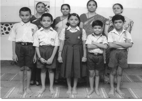
शिष्यवृत्तीप्राप्त विद्यार्थ्यांसह त्यांच्या मार्गदर्शक शिक्षिका