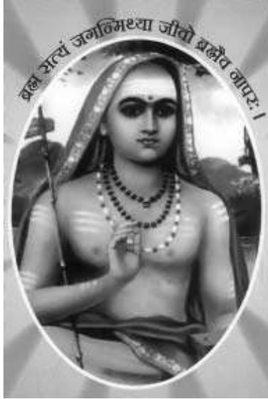
श्रीमत् आद्य शंकराचार्य

हिन्दु परंपरेत स्तोत्रांना अनन्यसाधारण महत्त्व आहे. अनेक स्तोत्रांतील अक्षर नू अक्षर सिद्ध मंत्राप्रमाणे प्रभावी आहे असे नित्यपठण करणारांचे अनुभव आहेत. माणसाला अखंडपणे स्फूर्ती देणारे प्रेरणा स्रोत म्हणजे स्तोत्रे असेही सांगितले जाते. पुराणकाळापासून अनेक स्तोत्रांनी भारताचे आध्यात्मिक साहित्य संपन्न केले आहे. याज्ञवल्क्य ऋषींनी रचलेली स्तोत्रे, नारद पुराणातील स्तोत्रे इ. अनेक स्तोत्रे जशी आजही श्रद्धाभावाने म्हटली जातात, नित्य पठणाने सरावात असतात, तशीच आद्यगुरू श्री शंकराचार्यांची अनेक स्तोत्रेदेखील आज नित्य पठणात असावीत.