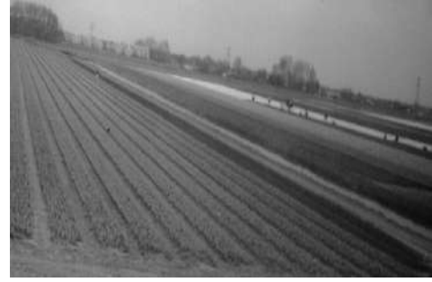
ट्युलिपच्या बागा ह्या अशा विस्तृत आहेत

हॉलंडमधील एक प्रमुख आकर्षण आहे. दुरून गुलाबासारखी वाटणारी ही विविध रंगी फुले युरोपांत शिरल्यापासून लक्ष वेधून घेत होती. येथील गार्डन्समध्ये ह्या फुलांचे पीक मोठ्या प्रमाणावर घेतले जाते. मार्च अखेर ते मे चा मध्य हा त्यांचा मोसम असतो. ह्या ट्युलिपच्या विस्तीर्ण बागा आणि त्यामधील विविध रंगांची फुले हे अगदी डोळ्यांचे पारणे फेडणारे देखणे दृश्य असते.