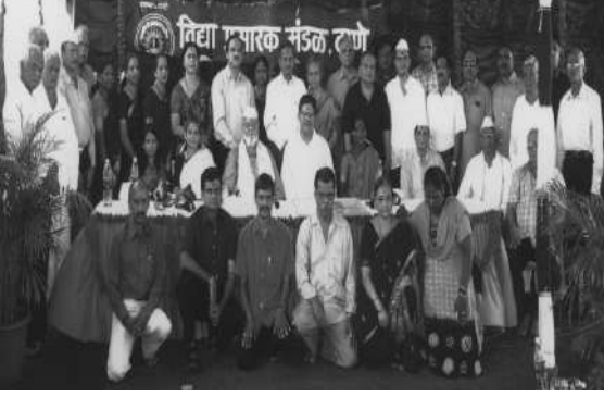
मंडळाचे सर्व सदस्य

सांगितले. विद्या प्रसारक मंडळ, ठाणे यासारख्या प्रथितयश शैक्षणिक संस्थेने कोकणात शैक्षणिक प्रकल्पाचे काम हाती घेतल्याबद्दल आनंद व्यक्त केला. त्याचप्रमाणे स्थानिक लोकप्रतिनिधी म्हणून कोणतीही मदत, सहकार्य करण्यास कायमच आपल्याबरोबर असू असे सांगून मंडळाच्या प्रकल्पास शुभेच्छा दिल्या. वेळणेश्वराच्या सरपंचांनी मंडळाच्या या प्रकल्पाला सर्व ग्रामस्थांच्या वतीने शुभेच्छा दिल्या.