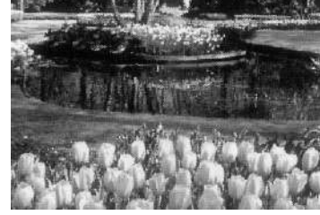
कुकेन हॉफ गार्डन (ट्युलिपची बाग)

कुकेन हॉफ गार्डन्स ह्या ट्युलिपच्या बागा हे