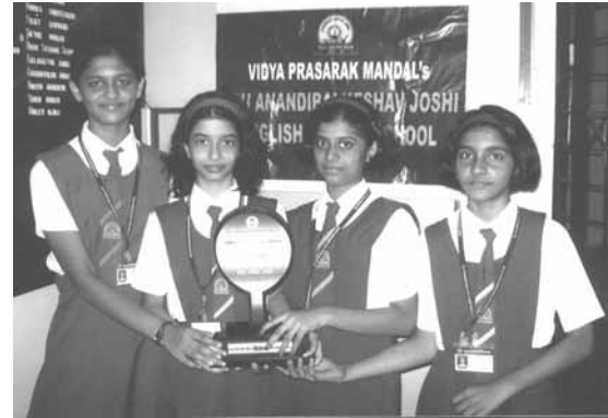
टेबल टेनिस स्पर्धेतील विद्यार्थी