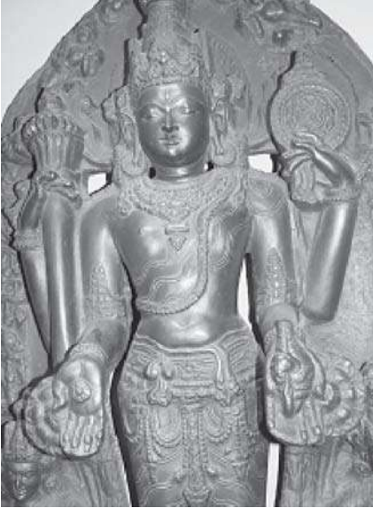
श्री विष्णूची मूर्ती

अशमोलियन संग्रहालयात एक विभाग आहे आशिया खंडाचा. या परिसरात सापडणाऱ्या अनेक वस्तूंचा संग्रह येथे करून ठेवलेला आहे. आशिया खंडाच्या विविध भागांत आढळणाऱ्या मूर्ती येथे पद्धतशीरपणे ठेवलेल्या आहेत. या मूर्तींमध्ये आपले लक्ष वेधून घेते ती विष्णूची मूर्ती. व्यापाराच्या निमित्ताने जेव्हा इंग्रज येथे आले तेव्हा येथील काही वस्तू ते घेऊन गेले. सुरुवातीच्या काळात नेलेल्या वस्तूंमध्ये या विष्णूच्या मूर्तीचा समावेश होतो. धातूच्या या मूर्तीचे वेगवेगळे भाग अगदी रेखीवपणे दिसतात. खाली अगदी कमी उजेडात काढलेले या मूर्तीचे चित्र छापलेले आहे. त्यावरून या मूर्तीची कल्पना येईल.