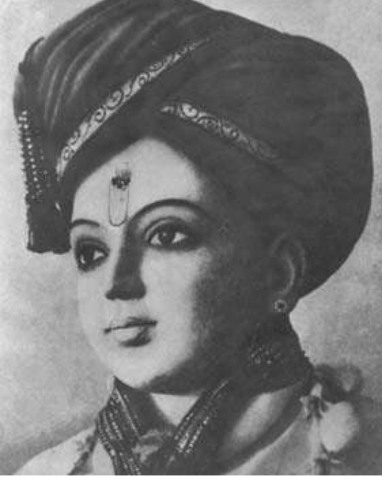
संत ज्ञानेश्वर महाराज

ब्रह्मज्ञानाचा अर्थ-परार्थ मराठीतून सांगितला जसा की - ‘बोली अरुपाचें रूप दावीन ।