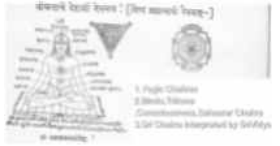
चित्र नं १ पिंड ब्रह्माण ऐक्य

ह्याचा अर्थ असा आहे की 'हे सोम्य! हे पिंडच ब्रह्मांड आहे, असे जाण!! पिंडामध्ये ब्रह्मांड समाप्त है - (पूर्णपणे सामावले आहे - व्यक्त स्थितीत आहे.