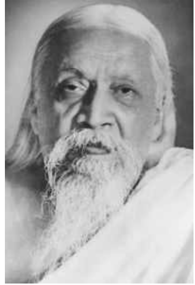
महायोगी अरविंद घोष

दिले, हे सांगत होतो; पुढे मला 'अन्न' ह्या शब्दाची बीजात्मक, व्यापक, वैदिक व तैत्तरीय उपनिषदातील (बीज) संकल्पना सांगावयाची होती.