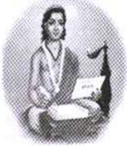
श्री संत ज्ञानेश्वर महाराज

अगदी अलीकडेही, पैठणच्या धर्ममार्तंड ब्राह्मणांनी ज्ञानेश्वर प्रकृति चतुष्टयाला, वेदांचे अधिकार नाकारले व शेवटी ज्ञानेश्वरांनी 'रेड्याच्या मुखातून वेद म्हणावयाला लावले.'