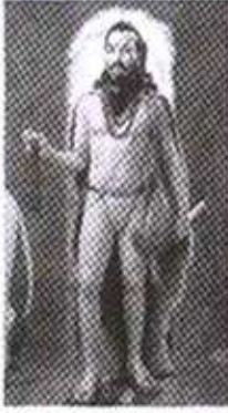
श्री संत समर्थ रामदास

sciousness आहे. मग तिच्या या रथाला 'अरुण अश्व' कोणते?