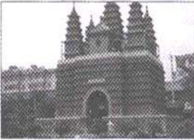
पंचपगोड्याची देखणी इमारत

इमारतीच्या वर जाण्यासाठी एक बळगावळणाचा रस्ता आहे. हा रस्ता इतका अरुंद आहे की एका वेळेस फक्त एकच व्यक्ती जाऊ शकते. वर गेल्यावर पाच पगोडे स्पष्ट दिसतात. इमारतीच्या चार कोपऱ्यांत चार आणि मध्यभागी एक, असे पाच पगोडे तिथे आहेत. त्यांतील प्रत्येक पगोड्यावर अतिशयचांगली कलाकृती कोरलेली आहे.