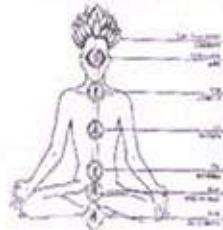
This diagram indicates the position of the chakras and their related nerves.

कारण, भारतीय समाज ह्या सत्यशोधनाचा कार्यात अनेक युगे व शतके व अनेक पिढ्यांमध्ये कार्यरत आहे. अर्जुन शोध पुरा झाला नाही. काही सत्ये प्राप्त झाली आहेत, पण गोंधळाची भरपूर आहे. ह्या गोंधळातून सत्यमार्ग शिताफीने पकडावयाला लागेल.