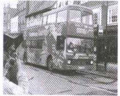
केम्ब्रिज टूर बस

व्यक्तीने आमहांला दिली. आजूबाजूचे निरीक्षण करीत आम्ही बस येण्याची वाट पाहू लागलो. आमहांला जास्त वेळ ताटकळत बसावे लागले नाही. थोड्याच वेळात "बस आली, बस आली" असा गलका विद्यार्थ्यांनी केला. ही बस ओळखायला फार सोपी आहे. लाल रंगाने रंगविलेल्या या बसवर (Cambridge Tour) असे ठळकपणे लिहिलेले असते.