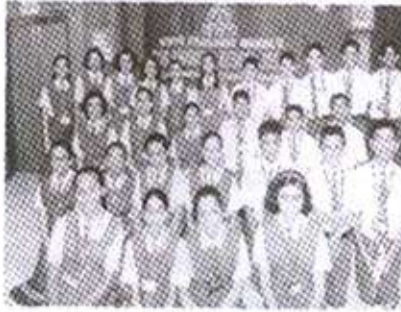
सी. ए. के जोशी इंग्लीश मिडियम स्कूल ठाणे, माध्यमिक शिष्यवृत्तीधारक

खालील विद्यार्थ्यांना शहरी विभागातून शिष्यवृत्ती मिळाली.