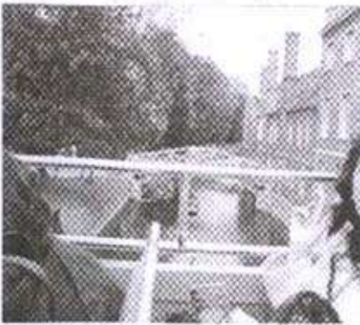
नदीवरील भौमितीय पूल

बसस्टॉपवर आम्हांला फार वेळ थांबावे लागले नाही. थोड्याच वेळात केंब्रिज टूरची दुसरी बस आली. परत त्या बसच्या वरच्या मजल्यावर आम्ही जाऊन बसलो आणि आमची सहल पुनश्च सुरू झाली. बस आता जुन्या वस्तोतून जाऊ लागली. दोन्ही बाजूला दगडाने बांधलेल्या जुन्या इमारती होत्या. ह्या इमारतींमध्ये केंब्रिज विद्यापीठाची कॉलेजेस् आहेत असे गाईडने सांगितले. अशा अनेक कॉलेजचे मिळून केंब्रिज विद्यापीठ तयार झाले आहे. सेंट जॉन्स कॉलेज, क्लॉन्स कॉलेज अशी अनेक कॉलेजेस मागे टाकत बस प्रसिद्ध केंब्रिज पुलावर आली. या पुलावर बस थांबताच आम्ही सर्वजण खाली उतरलो. आजूबाजूचा परिसर पर्वटकांनी गजबजून गेला होता. कॅम या नदीवर बांधलेला हा पूल आहे. खरे तर कॅम नदीवर बांधलेला ब्रिज या अधिनि गावाला केंब्रिज असे नाव पडले आहे. केंब्रिज नदीतून अनेक बोटी जात असलेल्या आपल्याला दिसतात. याला पटींग असे म्हणतात. अनेक पर्यटक शुल्क देऊन नदीतून बोटीने फेरफटका मारून येतात. या पुलाच्या शेजारीच एक लाकडी पूल आहे. त्याला भौमितीय पूल (Geometical Bridge) असे म्हणतात. पुलावरील दृश्य पाहून झाल्यावर आम्ही परत बस स्टॉपवर आलो आणि मागच्या बसची वाट पाहू लागलो.