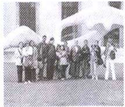
संग्रहालयाच्या समोर घेतलेले छायाचित्र

बजू लागली. तेव्हाच गाईडने आम्हांला पुढे बघायला सांगितले. बघतो तर सर्वत्र झाडेच झाडे. हा केंब्रिजच्या बोटनिकल गाईडचा परिसर असल्याचे त्याने सांगितले. कोणाला उतरायचे असेल उतरू शकता, अशी सूचना ही गाईडने केली. परंतु ऑक्सफर्ड बोटनिकल गाईड आम्ही पाहिले असल्याने केंब्रिजचे गाईड पाहण्याचे नाही असे आम्ही ठरविले होते. म्हणून आम्ही बसमध्येच बसून राहिलो. बस पुढे जात राहिली. गाईडचे मार्गदर्शन सुरूच होते. केंब्रिज शहरावरून तो माहितो देत होता. थोड्याच वेळानंतर आणखी एक थांबा आला. हा थांबा फिट्झ विल्यम संग्रहालयाचा असल्याचे जेव्हा आम्हांला कळले तेव्हा तेथे उतरायचे ठरविले. आमच्या बसमधील बहुतेक सर्वजण या थांब्यावर उतरले. तिथे बसची वाट पाहणारे प्रवासी बसमध्ये चढले आणि आमची बस निघून गेली. फिट्झ विल्यम संग्रहालय आकाराने विस्तीर्ण आहे. येथे धातू, काच, चिनीमातीच्या अनेक सुंदर सुंदर वस्तू ठेवलेल्या आहेत. तळमजला संपूर्ण धातूच्या वस्तूसाठी, वरचा मजला चिनीमातीच्या वस्तूसाठी आणि सर्वांत वरचा मजला रंगीत चित्रांसाठी वापरला आहे. साधारणपणे तसतसर संग्रहालयात फिरून आम्ही बसस्टॉपवर परत आलो. फिट्झ विल्यम भेटीवर एक स्वतंत्र लेख लिहिण्याचा विचार आहे.