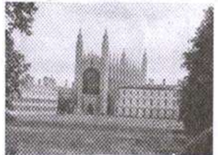
किंग्ज कॉलेज, चॅपेल

लपकरच बस आली आणि आमची पुढची सहल सुरू झाली. गाईडने लगेच सांगितले की बसच्या पुढे असलेले कॉलेज डार्विन कॉलेज असून उजवीकडच्या कॉलेजचे नाव क्लॉन्स कॉलेज असे आहे. काही मॉटर पुढे गेल्यावर बस उजवीकडे वळली. बस वळताच गाईडने आम्हांला आपले कॅमेरे तयार ठेवायला सांगितले. आमचे प्रत्येकाचे कॅमेरे तयार होतेच. तरीही एका महत्वाच्या ठिकाणाचे दर्शन होणार आहे यासाठी कॅमेरे तयार ठेवा असे गाईडला सुचवायचे होते. बस उजवीकडे वळून कॅम नदीला समांतर जाऊ लागली. नदी आणि रस्ता यांमधील जागा मोकळी असून त्यावर चांगलेच गवत वाढविले होते. गवताच्या भोवताली मोठमोठाली झाडे आहेत. आमची सहल मे महिन्यात होती. त्यामुळे सर्व झाडांना नवीन पालवी आलेली होती. जवळ गवताळ पटांगण, त्यापुढे नदी आणि दूरवर कॉलेजच्या इमारती असे दृश्य पाहात आम्ही पुढे चाललो होतो. तेवढ्यात एकदम गलका झाला. एक अतिशय सुंदर दृश्य आमच्या नजरेस पडले. दोन झाडांच्यामधून दिसणारे भव्य चर्च असे ते दृश्य होते. हे किंग्ज कॉलेजचे चर्च असल्याचे गाईडने आम्हांला सांगितले. आम्ही सर्वांनीच पटापट फोटो काढले. बस पुढे जात राहिली. थोड्याच वेळानंतर केंब्रिज विद्यापीठ ग्रंथालयाचा थांबा आला. या थांब्यावर आम्ही बसमधून उतरलो.