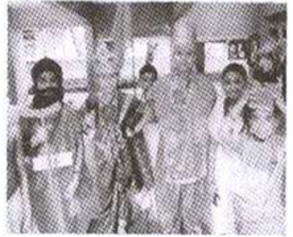
'एकलव्य' मधील कलाकार

गुरुगोर्णमिच्या दिवशी गुरुविषयी असलेला आदरभाव दर्शवीत प्राथमिक विभागाच्या विद्यार्थ्यांनी 'एकलव्य' ह्या गुरू व शिष्याची गोष्ट नाटकाद्वारे सादर केली. तसेच, श्लोकांद्वारे सर्वांच्या कल्याणासाठी प्रार्थना केली.