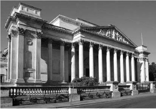
संग्रहालयाची भव्य वास्तू

प्राच्यविद्या अभ्यास संस्था यांच्या वतीने भारतीय विद्यार्थ्यांसाठी दरवर्षी उन्हाळ्यात एक शैक्षणिक सहल आयोजित करण्यात येते. या सहलीत इंग्लंडमधील ऑक्सफर्ड, केंब्रिज आणि लंडन या तीन महत्त्वाच्या शहरांना भेटी आयोजित केल्या जातात. सुरुवात ऑक्सफर्ड पासून होते. ऑक्सफर्ड शहरात तीन दिवस घालविल्यानंतर विद्यार्थ्यांचा चमू केंब्रिजला येतो. प्रथम केंब्रिज दूर बसच्या टपावर बसून आणि पायी फिरून शहराची ओळख करून घेतली जाते. त्यानंतर शहरातील निवडक पण महत्त्वाच्या ठिकाणांना भेटी दिल्या जातात. त्यातील फिट्झविल्यम संग्रहालय हे एक ठिकाण आहे. केंब्रिजच्या ट्रॅपिंगटन मार्गावर वसलेले हे संग्रहालय आमच्या राहण्याच्या ठिकाणापासून जवळच होते. साधारणपणे १०-१५ मिनिटे चालत गेलो की आपण या संग्रहालयाजवळ पोहोचतो.