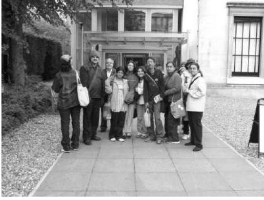
प्रवेशद्वाराजवळ घेतलेले छायाचित्र

नव्हता.त्या संग्रहालयाचा नियमच तसा आहे. अगदी फोटोसुद्धा काढू नये एवढे काय महत्त्वाचे तेथे आहे? असा प्रश्न आम्हांला पडला. या प्रश्नाचे उत्तर आम्हांला संग्रहालयात प्रवेश करताच मिळाले.