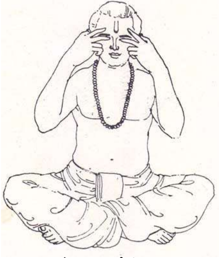
पंथराज चतुर्मुखी मुद्रा