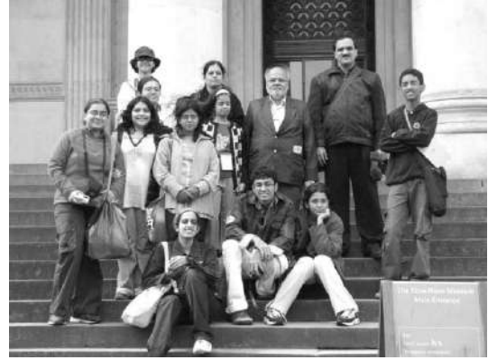
संग्रहालयाच्या पायऱ्यांवर घेतलेले छायाचित्र

फ्रेंड्स रूम बघण्याच्या निमित्ताने आम्ही मधल्या (Mazanine) मजल्यावर आलोच होतो. तेथून जिऱ्याने आम्ही तळमजल्यावर आलो. क्लॉक रूममध्ये ठेवलेल्या आमच्या बॅगा घेतल्या आणि उपहारगृहात गेलो. थंडी चांगलीच होती. त्याचबरोबर संग्रहालय फिरून आम्ही थकलो होतो. या पार्श्वभूमीवर चहाची गरज होती. चहा घेऊन तरतरी आल्यावर प्रत्येकजण संग्रहालयाच्या दुकानात खरेदी करण्यात मशगुल झाला. आम्ही संग्रहालयात गेलो तेव्हा आमच्या बॅगा रिकाम्या होत्या. परंतु संग्रहालयातून बाहेर पडताना मात्र आमच्या बॅगा भरलेल्या होत्या. केवळ बॅगांतच भर पडली असे नाही तर संग्रहालय पाहून आमच्या ज्ञानात देखील चांगलीच भर पडली होती.