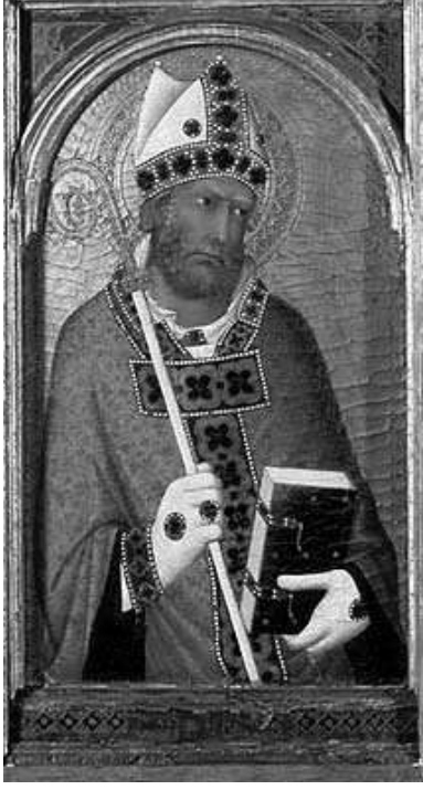
एक सुंदर चित्र

हातपंख्यांचे प्रदर्शन पाहून आम्ही २७ क्रमांकाच्या दालनात आलो. हे खूपच मोठे असून लांबट आकाराचे आहे. या संपूर्ण दालनात युरोपातील मातीची भांडी (European Pottery) ठेवलेली आहेत. चिनी मातीची वेगवेगळ्या आकाराची भांडी आणि त्यावर केलेली रंगीबेरंगी कलाकुसर आपले लक्ष वेधून घेते. बाहेरचा भरपूर प्रकाश आत येईल अशा पद्धतीने मोठमोठ्या खिडक्या या खोलीला ठेवलेल्या आहेत. या खिडक्यांना लावलेली काचेची तावदाने रोज स्वच्छ केली तातात. त्यांतून खोलीत आलेला सूर्यप्रकाश सर्व भांडी उजळून टाकतो. त्यामुळे अनेक भांडी चकाकताना दिसतात. या दालनात दोन्ही बाजूला लावलेली भांडी बघत बघत आम्ही २८ क्रमांकाच्या खोलीत प्रवेश केला. या खोलीत पूर्वेकडील दूरच्या देशात आढळणाऱ्या वस्तू ठेवलेल्या आहेत. त्यात समावेश होतो, थायलंड, मलेशिया, व्हिएतनाम, कंबोडिया