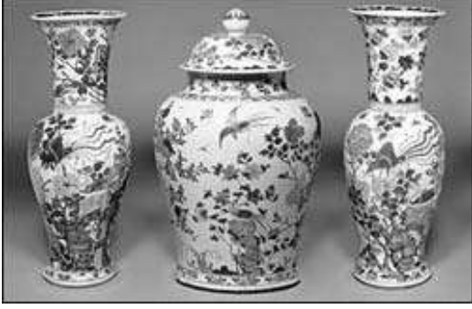
चिनी मातीची भांडी

जागा वापरलेली आहे. काही वस्तू काचेच्या कपाटात ठेवलेल्या आहेत तर काही वस्तू उघड्यावर ठेवलेल्या आहेत.