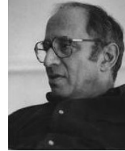
- थॉमस कुन्ह

अनुभूतिशास्त्राच्या अभ्यासाला मात्र ह्या सर्वसाधारण अर्थ बोधाच्या पद्धतीच्या 'अपूर्णतेची व ब्रह्मज्ञानाच्या विविध स्तरावरील व अवस्थेतील अर्थप्राप्तीच्या अनंत प्रकारांची जाणीव आवश्यक होईल. हे अर्थबोध व प्रकार व भेद जाणून योग्य समर्पक अर्थपद्धती वा एकात्म म्हणजे पद्धतीची गरज आहे. हे अत्यंत आवश्यक बदल होणे जरूरीचे आहे. भौतिकवादी ज्ञानी व विव्धान्तता बहुतांगी ही जाणीव नसते, म्हणूनच त्यांच्या ज्ञानपद्धतीतील "Paradigan Bound" सांप्रदायिक जडवादी विज्ञानाची ही मर्यादा Thomas Kunh ह्या शास्त्रज्ञाने उघड मांडली आहे.