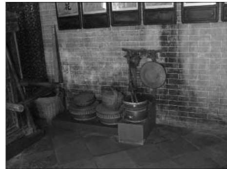
घरातील जुन्या वस्तू

या पर्यटन स्थळात जागोजागी आपल्याला प्रदर्शन पाहायला मिळते. आता काही लोकांनी लहानलहान दुकाने देखील तेथे थाटलेली आहेत. येणारे पर्यटक तेथे खरेदी करताना आढळतात. या वस्तूंमध्ये कारखान्यात तयार होणाऱ्या वस्तूपेक्षा गावातील कलाकारांनी तयार केलेल्या वस्तूंचाच भरणा अधिक असतो. जुनी घरे, जुन्या किंवा ग्रामीण वस्तू असाच या परिसराचा साज आहे.