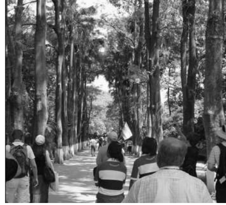
स्मारका सभोवतीची वनराई

होती. त्यावेळेस घरात काय सुविधा होत्या याची कल्पना आपल्याला हे ठिकाण पाहून येते.