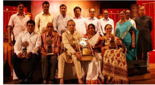
जनकवी पी. सावळाराम पुरस्कार २०१३ चे मानकरी

जीवनाकडे पाहण्याची दृष्टी बदलली की विषयही बदलतात.