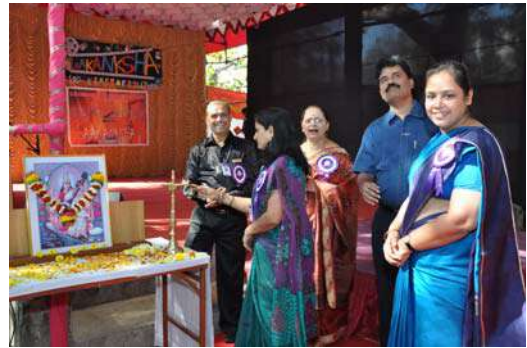
'आकांक्षा २०१३' चे उद्घाटन करताना

दि. २० डिसेंबर २०१२ ते २४ डिसेंबर २०१२ या कालावधीत 'आकांक्षा' चे विविध कार्यक्रम झाले. या वर्षी ही संकल्पना बॉलीवुडची १०० वर्षे ही होती.