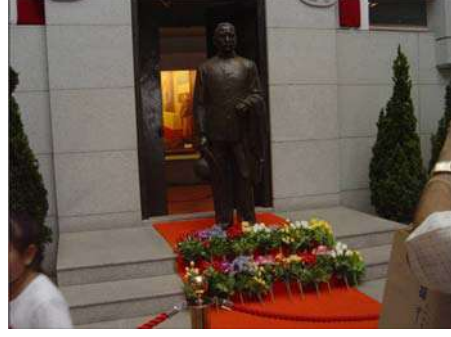
सन यात सेनचा पुतळा

ज्ञोगशान येथील स्मारकाला भेट देऊन आम्ही परतीच्या प्रवासाला सुरुवात केली. परतीच्या प्रवासात आमच्या तोंडी दोनच गोष्टी होत्या. एक तर सन यातसेनचा चीनच्या बांधणीत सहभाग आणि दुसरे म्हणजे स्मारक सांभाळून ठेवण्याची सध्याच्या सरकारची पद्धत. अशा स्मारकाने आपल्या पुढाऱ्याची आठवण तर राहतेच त्याचबरोबर पुढच्या पिढीला प्रेरणा देखील मिळते.