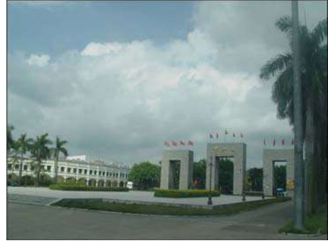
झोगशान गावाचे प्रवेशद्वार

लागतात. रस्त्याच्या मधोमध आणि रस्त्याच्या दोन्ही बाजूला सुंदर झाडे लावलेली आहेत. त्यामुळे संपूर्ण प्रवासात आपण जणू बागेतच आहोत असे वाटते. संपूर्ण रस्ता गुळगुळीत असून कोठेही खड्डा शोधूनदेखील सापडत नाही. त्यामुळे प्रवास सुखाचा झाला. तीन तास गाडी चालवून झाल्यावरदेखील कोणत्याही प्रकारचा थकवा चालकाच्या चेहऱ्यावर जाणवला नाही.