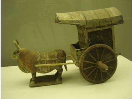
बैलगाडीची हूबेहूब प्रतिकृती

चीनीमातीपासून बनविलेल्या शोभिवंत भांड्यांचा एक वेगळाच विभाग आहे. यांत अगदी लहान कपापासून ते खूप मोठ्या आकाराच्या भांड्यांपर्यंत विविध आकाराच्या आणि रंगाच्या वस्तूंचा समावेश आहे. प्रत्येकावर केलेले नक्षीकाम इतके सुबक आणि सुंदर आहे की पर्यटकांचे लक्ष वेधून घेतल्यावाचून राहात नाही. अशा वस्तू चीनमध्ये अजूनही बनविल्या जात आहेत. बाजारात त्या विकण्यास देखील ठेवलेल्या आढळतात. या संग्रहालयात असलेल्या