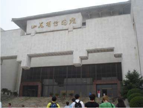
संग्रहालयाची भव्य दगडी इमारत

चीनमध्ये प्रत्येक प्रांताच्या राजधानीच्या ठिकाणी त्या प्रांताचे वैशिष्ट्य विशद करणारे संग्रहालय उभारलेले आहे. जीनान ही शानडॉंग प्रांताची राजधानी असून या शहरात चिनी प्रजासत्ताकाची स्थापना झाल्यावर लगेच या संग्रहालयाची स्थापना करण्यात आली. संग्रहालयाच्या जवळ पोहोचताच त्याची पांढऱ्या रंगाची दगडी इमारत आपल्या नजरेत भरते. जीना चढून संग्रहालयाच्या प्रवेशद्वाराकडे जाण्याआधी मोठ्या दगडात कोरलेल्या कासवाचे आपल्याला दर्शन होते. सहस्रबुद्ध डोंगराच्या पार्श्वभूमीवर बांधलेले हे वस्तुसंग्रहालय सुंदरच नाही तर भव्यदेखील आहे. यात २१,००० मीटर एवढा परिसर प्रदर्शनासाठी ठेवलेला आहे. या संग्रहालयात एकूण १०,५०० एवढ्या वस्तू आहेत. त्याचबरोबर १२,०००० एवढी पुस्तके आहेत. अशा भव्य संग्रहालयाचा जरा फेरफटका मारू या.