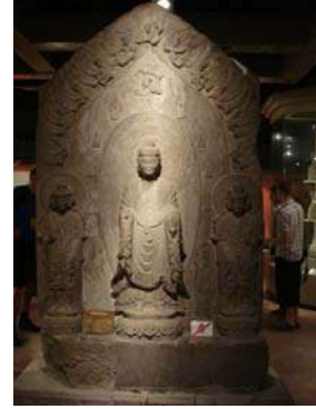
बुद्धाची दगडात कोरलेली मूर्ती

दगडांमध्ये मूर्त्या कोरण्याची कला फार प्राचीन काळात उदयास आली. जेथे मूर्त्या कोरायला योग्य असे दगड आढळले तेथे तेथे लोकांनी मूर्त्या कोरून ठेवलेल्या आहेत. त्यांतील काही मूर्त्यांचे प्रदर्शन या संग्रहालयात केलेले आढळते. त्यातील एक मोठा विभाग राखून ठेवलेला आहे. यावरून ही कला येथे प्रचलित असून आजूबाजूला मूर्त्या कोरण्यास लागणारा दगड मुबलक उपलब्ध आहे याची आपल्याला माहिती मिळते.