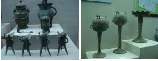
उत्खननात सापडलेल्या धातूच्या वस्तू

यांमध्ये प्रामुख्याने ब्राँझच्या वस्तू आहेत. त्याचेही कीतीतरी आकार आपल्याला पाहायला मिळतात. अगदी मेणबत्तीच्या स्टँडपासून ते बैलगाडीच्या प्रतिकृतीपर्यंतच्या वस्तू आपल्याला आढळतात. त्यांचे वैशिष्ट्य असे की त्या सगळ्या वस्तू स्वच्छ करून पद्धतशीरपणे लावून ठेवलेल्या आहेत. कोणत्याही वस्तूचे छायाचित्र काढण्याची मुभा आहे. त्यामुळे आम्ही भरपूर छायाचित्रे काढली. त्यांतील काही खाली दिलेली आहेत.