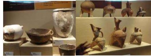
उत्खननात सापडलेली मातीची भांडी

संग्रहालयात प्रवेश करून आपण डावीकडे वळतो तोच आपल्याला उत्खननात सापडलेल्या वस्तूंचे प्रदर्शन पाहायला मिळते. यांत प्रामुख्याने मातीची भांडी आणि धातूच्या वस्तू आढळतात. वस्तू कोणत्या ठिकाणी उत्खननात सापडली तिचा कालावधी काय असावा याची माहिती सविस्तरपणे दिलेली आहे. लाकडी कपाटात या वस्तू ठेवलेल्या असून काचेच्या तावदानातून त्या स्पष्टपणे पाहता याव्यात यासाठी चांगली प्रकाशयोजना केलेली आहे.