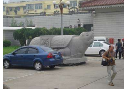
प्रवेशद्वाराजवळ असलेला दगडी कासव

संग्रहालयात प्रवेश करून आपण डावीकडे वळतो तोच आपल्याला उत्खननात सापडलेल्या वस्तूंचे प्रदर्शन पाहायला मिळते. यांत प्रामुख्याने मातीची भांडी आणि धातूच्या वस्तू आढळतात. वस्तू कोणत्या ठिकाणी उत्खननात सापडली तिचा कालावधी काय असावा याची माहिती सविस्तरपणे दिलेली आहे. लाकडी कपाटात या वस्तू ठेवलेल्या असून काचेच्या तावदानातून त्या स्पष्टपणे पाहता याव्यात यासाठी चांगली प्रकाशयोजना केलेली आहे.