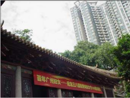
जुने मंदिर आणि नवीन गगनचुंबी इमारत

किशोरांसाठी आयोजित केलेल्या नवनिर्मिती स्पर्धेत भाग घेण्यासाठी आम्ही गॉॅच्यू येथे गेलो होतो. आमच्या खेरीज आणखी ११ देशांतील स्पर्धक या स्पर्धेत सहभागी होण्यासाठी आले होते. या ११ देशांतील पाहुण्यांना संयोजकांनी खास सुविधा पुरविल्या होत्या. स्पर्धेबरोबर शहराची आणि आजूबाजूच्या परिसराची माहिती पाहुण्यांना व्हावी यासाठी स्पर्धेतून सवड काढून सहल आयोजित करण्यात येते. स्पर्धेची सुरुवात सोमवारी व्हायची होती. रविवार हा तयारी करण्याचा आणि प्रकल्प लावण्याचा दिवस होता. हे काम लवकर आटपा, म्हणजे जेवणानंतर आपण शहरात फेरफटका मारून येऊ असे आम्हांला संयोजकांनी बजावले होते. त्यांच्या सूचनेनुसार आम्ही प्रदर्शनाच्या ठिकाणी सकाळी लवकर पोहोचलो आणि जेवणाची वेळ होण्याच्या आधी आपले काम आम्ही संपविले. ठरल्याप्रमाणे हॉटेलवर येऊन आम्ही दुपारचे जेवण आटोपले. त्यानंतर शहरातील नांगजियांग सुओ (Nangziyang Suo) या महत्त्वाच्या स्थळाला भेट देण्यासाठी निघालो.