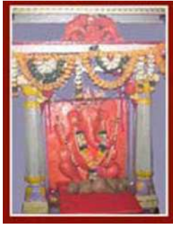
महडचा गणपती वरद विनायक

पालीहून ३८ किमी वर खोपोलीपासून १.५ कि.मी. अंतरावर महड या ठिकाणी गेलो. महडचा गणपती वरद विनायक नावाने प्रसिद्ध आहे. या मंदिरा संदर्भात एक कथा आहे की एका भक्ताला स्वप्नात देवळाच्या मागील बाजूस असलेल्या तळ्यात पडलेली मूर्ती दिसली त्याप्रमाणे त्या भक्ताने शोध घेतला व मूर्ती मिळाली तीच या मंदिरातील प्रतिष्ठापना केलेली मूर्ती होय. मंदिरात दगडी महिरप असून गणेशाची मूर्ती सिंहासनारूढ आहे. हा गणपती उजव्या