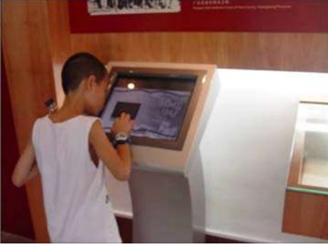
माहिती देण्यासाठी तंत्रज्ञानाचा उपयोग

प्रेक्षणीय स्थळाच्या मध्यभागी जी इमारत आहे ती प्रामुख्याने सभागृहाची इमारत आहे. तेथे पुढारी आणि कार्यकर्ते यांच्या सभा होत असत. नवीन स्वयंसेवकांना प्रबोधन येथेच दिले जाई. या सभांचे स्वरूप कसे होते याचे चित्ररूप प्रदर्शन आपल्याला या इमारतीत पाहायला मिळते. इमारत जुन्या पद्धतीची असून चीनी देवळे ज्या पद्धतीने बांधली जातात त्याच पद्धतीने या इमारतीचे काम करण्यात आलेले आहे. बाहेरून ही इमारत अतिशय सुंदर दिसते. चीनी क्रांतीचे उगमस्थान म्हणून या ठिकाणाकडे पाहता येईल. चीनी राज्यकर्त्यांनी या स्थळाचे चांगले जतन केलेले आहे. विशेष म्हणजे त्या वेळच्या क्रांतीच्या जनकाची तत्त्वे त्यांनी पूर्णपणे सांभाळली नाहीत. गरजेप्रमाणे त्यांनी त्यात सुधारणा केली आणि बदल केले तरीही समाजवादाचा मूळ ढाचा त्यांनी बदललेला नाही.