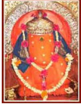
मोरगांवचा श्री मयूरेश्वर

गणेशभक्त मोरया गोसावी यांनी येथील पूजेचा वसा घेतला होता. स्वयंभू व आद्यस्थान असलेली ही गणेशाची मूर्ती आहे. प्रत्येक घरा-घरात म्हटली जाणारी 'सुखहर्ता दुःखहर्ता' ही गणपतीची आरती श्री समर्थ रामदास स्वामींना याच मंदिरात स्फुरली असे म्हटले जाते. मंदिराचे बांधकाम