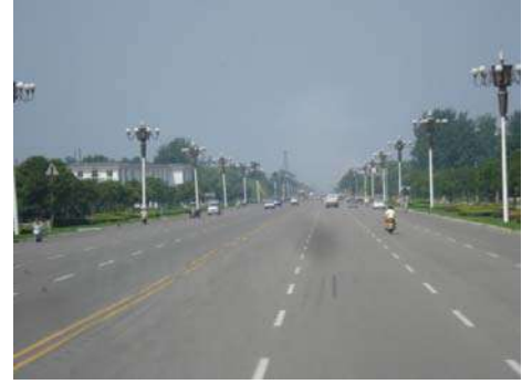
क्युफ्यू शहरात प्रवेश

क्युफूमधील धार्मिक स्थळाला एक परकोट बांधलेला असून त्या परकोटाला दारे आहेत. त्यांतील एका दारातून आपल्याला प्रवेश घ्यावा लागतो. दारातून आत जाताच एक मार्गदर्शक नकाशा आपल्याला पाहायला मिळतो. त्यावर कोठे काय आहे याची सविस्तर माहिती दिलेली आहे. पुढे पाहावे तर एक प्रकारचे जंगल आपल्याला दिसते. आता येथे जंगल जरी वाढले असले तरी प्रत्यक्षात ही स्मशानभूमी आहे. कम्प्युसिअस घराण्यातील लोकांचा मृत्यू झाल्यानंतर त्यांचे शरीर येथे पुरून ठेवण्यात येत असे. मागील काही वर्षांपासून या दफनभूमीचा वापर होत नसल्याने आजूबाजूला जंगल वाढले आहे. या जंगलातून मार्गक्रमण करीत आपण जेव्हा