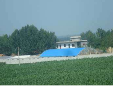
वाटेवरील विलोभनीय दृश्य

साधारणपणे तीन तासांच्या प्रवासानंतर आम्ही क्युफूला पोहोचला. चालकाने गावात जाणाऱ्या मार्गावर बस वळविली आणि चित्रच पालटले. गावात प्रवेश करताच आपण प्रेक्षणीय स्थळाकडे जात आहोत याची जाणीव होते. सोनरी रंगाने नक्षीकाम केलेले सुंदर विजेचे खांब आपल्या नजरेस पडले. त्याचबरोबर वेगवेगळ्या रंगांनी सजविलेले रिक्षेही आपल्या नजरेत पडतात. पर्यटन केंद्राजवळ चालकाने बस थांबविली आणि आम्हांला खाली उतरायला सांगितले. धार्मिक स्थळाचे पावित्र्य राखण्यासाठी आणि प्रदूषण टाळण्यासाठी या स्थळाच्या पुढे वाहन न्यायला बंदी आहे. पुढच्या प्रवासासाठी