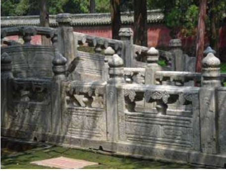
प्रवेशद्वार आणि स्मशानभूमी

कन्फ्युसिस नावाचा एक विचारवंत ख्रिस्तपूर्व काळात चीनमध्ये होऊन गेला. त्याचे जन्मवर्ष ख्रिस्तपूर्व ५५१ आणि मृत्यूवर्ष ख्रिस्तपूर्व ४७९ असे सांगितले जाते. याचाच अर्थ या स्थळाला कमीतकमी २५०० वर्षांचा इतिहास आहे. याच गावात कन्फ्युसिस यांचा जन्म झाला. सामाजिक स्थितीचा अभ्यास करण्यासाठी त्यांनी देशभ्रमण केले. परंतु सरतेशेवटी याच ठिकाणी येऊन ते स्थायिक झाले. त्यांचा मृत्यू येथेच झाला व त्यांना याच परिसरात पुरण्यात आले. कन्फ्युसिस यांचे थडगे चांगल्या अवस्थेत ठेवल्याचे आढळते. या थडग्यापर्यंत