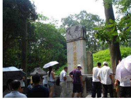
शिलालेख आणि थडगे

कन्फ्युसिसाचे मंदिर हे या परिसरातील मोठेच आकर्षण आहे. मंदिराची रचना चीनमधील इतर मंदिराप्रमाणेच आहे. परंतु मंदिराच्या दर्शनी भागात स्वस्तिकची चिन्हे आपल्याला ठळकपणे दिसतात. या