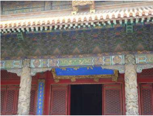
मंदिराचा दर्शनी भाग

कन्फ्युसिसअस विचारसणीचा चीनमध्ये प्रसार होतो आहे तोच मोठ्या संख्येने भारतातून बौद्ध भिक्षूक आले. त्यांनी चीनमध्ये आणखी भिक्षूक तयार केले. या सर्वांनी मिळून चीनमध्ये बौद्ध धर्माचा प्रसार केला. बौद्ध धर्माची विचारसरणी तिथल्या सामान्य लोकांच्या मनाला भिडली. त्यामुळे लोकांनी मोठ्या संख्येने बौद्धधर्माचा स्वीकार केला. आजही चीनमध्ये बौद्धधर्माचे लोक मोठ्या संख्येने आहेत. मागील काही वर्षांपासून कन्फ्युसिसअस धर्माचे पुनरुज्जीवन करण्याचा हेतुपुरस्सर प्रयत्न करण्यात येत आहे. कन्फ्युसिसअस धर्माची शिकवण नेमकी काय आहे याची माहिती सर्वसामान्यांना देण्याचा प्रयत्न करण्यात येत आहे. तसचे बौद्ध आणि इतर धर्मियांनी कन्फ्युसिसअस धर्माचा स्वीकार करावा यासाठीदेखील प्रयत्न करण्यात येत आहेत. त्यांच्या प्रयत्नांना जेव्हा यश येईल तेव्हा येईल. परंतु आजच्या घडीला मात्र बौद्ध धर्माच्या तत्त्वाचा पगडा लोकांवर चांगलाच असल्याचे जाणवते. हा धर्म भारताने आपल्याला दिला म्हणून भारतीयांबद्दल एक प्रकारची कृतज्ञता चिनी लोकांमध्ये आढळते. या सद्भावनेचा उपयोग करून भारतीय आणि चिनी लोकांमधील संबंध बळकट करणे सहज शक्य आहे. अशी संधी आता आपण घालविली तर परत मिळणार नाही.