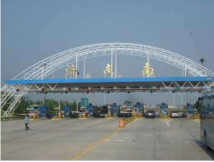
शहराच्या बाहेर पडताना असलेला टोल नाका

२००९ च्या ऑगस्ट महिन्यात जीनानला जाण्याची संधी मिळाली. जीनान हे शहर एक औद्योगिक शहर म्हणून ओळखले जाते. या शहराजवळच क्युफू नावाचे प्रसिद्ध धार्मिक स्थळ आहे. बौद्ध धर्माचा चीनमध्ये प्रसार होण्याआधी त्यांच्याकडे कन्फ्युसिअस (Confucious) नावाचा धर्म प्रचलित होता. या धर्माच्या संस्थापकाचे नाव कन्फुसिअस असेच होते. क्युफू हे या धर्माचे केंद्रस्थान होय. हे ठिकाण जीनानपासून सुमारे दोनशे किलोमीटरवर आहे. जीनान भेटीमध्ये एक दिवस राखून आयोजकांनी क्युफूची सहल आयोजित केली होती. या ठिकाणाला दिलेली भेट खरोखरच संस्मरणीय होती. त्याचेच वर्णन या लेखात केलेले आहे.