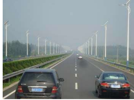
सोलर पॅनेल लावलेले विजेचे खांबे

दुतर्फा चांगली वनश्री अशा महामार्गावरून आमचा प्रवास सुरू झाला. महामार्ग केवळ रुंदच नव्हे तर गुळगुळीत होता. त्या रस्त्यावरून आमची बस वेगाने मार्गक्रमण करीत होती. रस्त्याच्या दुतर्फा विजेचे खांबे होते. प्रत्येक खांबावर सोलर पॅनेल बसविले होते. दिवसाचा उजेड असल्याने दिवे चालू नव्हते. परंतु रात्रीच्या वेळेस नेहमीच्या विजपुरवठ्याशिवाय हे दिवे पेटत असावेत याचा आम्हांला अंदाज आला. सूर्याच्या प्रकाशाचे सोलर पॅनेलमुळे विजेत रूपांतर होते. ही वीज खांबाच्या खालच्या बाजूला असलेल्या बॅटरीत साठवून ठेवली जाते. त्यावर खांबावरचे दिवे लागतात. मैलोगणती असे सोलरचे दिवे लावलेले पाहून जरा आश्चर्यच वाटले. दिव्याच्या खांबाचा आकार आणि त्यावर लावलेले दिवे यामुळे रस्त्याच्या सौंदर्यात भरच पडत होती.