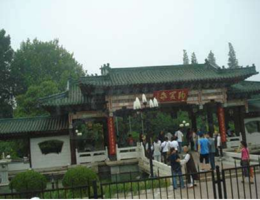
बाडुटू झऱ्याचे प्रवेशद्वार

मागील लेखात सांगितल्याप्रमाणे जीनान या शहरात जागोजागी अनेक झरे आहे. त्यातील बाडुटू झरा हा फारच प्रसिद्ध आहे. त्याच्या भोवती बगीचा निर्माण केलेला आहे. याखेरीज सुंदर सुंदर इमारती उभ्या केल्या आहेत. कधीकाळी ते राजकीय व्यक्तींच्या राहण्याचे ठिकाण होते. आता मात्र ते शहरातील एक प्रेक्षणीय स्थळ म्हणून नावाजलेले आहे. जीनान शहरात येणारी व्यक्ती या झऱ्याला भेट देतेच. या झऱ्याचे महत्त्व लक्षात घेऊन स्पर्धेच्या आयोजकांनी स्पर्धेतून वेळ काढून या झऱ्याला भेट आयोजित केली होती. झऱ्याच्या परिसरात प्रवेश करण्यासाठी शुल्क भरावे लागते. आमच्या यजमानांनी शुल्क भरून तिकीट घेतले व झरा आणि बाग यांचा फेरफटका मारण्यास सांगितले.