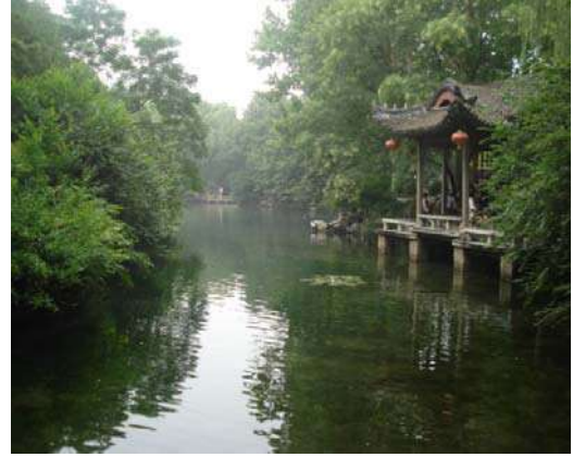
नाल्याच्या दुतर्फा असलेली वनश्री

लहानलहान नाले आहेत. या नाल्यांच्या दुतर्फा सुंदर झाडे लावलेली आहेत. शोभेच्या लहान झाडांबरोबरच मोठमोठे वृक्षदेखील तेथे आढळतात. एका प्रवेशद्वारातून आपण आधी आत जातो; काही अंतर पुढे गेल्यावर आणखी काही प्रवेशद्वारांतून आत जावे लागते. असे करीत करीत आपण झऱ्याजवळ पोहोचतो. जेथे झऱ्याचे पाणी येते तेथे एक मोठा हौद बांधलेला आहे. झऱ्याचे पाणी वेगाने या हौदात येताना आपल्याला पाहायला मिळते. हौदाच्या सर्व बाजूंनी चांगल्या पायऱ्या बांधलेल्या आहेत. त्यामुळे एखाद्याला पाण्यात उतरायचे असेल तर ती इच्छादेखील पूर्ण करून घेता येते. आम्ही गेलो ते दिवस उन्हाळ्याचे होते. बाहेरचे तपमान २४ ते २५ अंशाच्या आसपास असेल. परंतु हौदातील पाण्याचे तापमान मात्र याहून कमी होते. पाणी हाताला गार लागत होते. या पाण्यात रंगीबेरंगी मासे मनसोक्त पोहत होते.