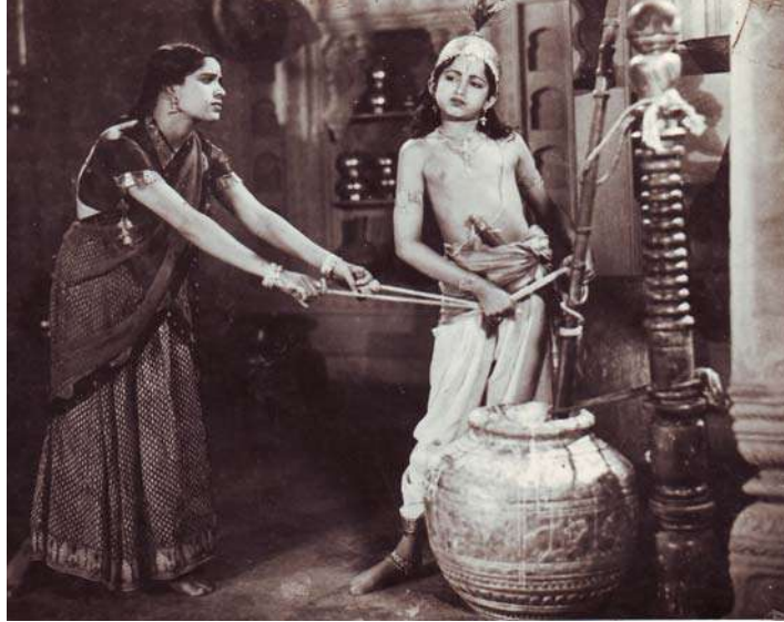
रामभाऊंच्या संगीत नाटकातील एक दृश्य

२३ ऑक्टो. १९२४, पुणे येथे त्यांचा जन्म! बालपणी तबल्याचे शिक्षण घेत असतानाच गोपाळ गायन समाजात