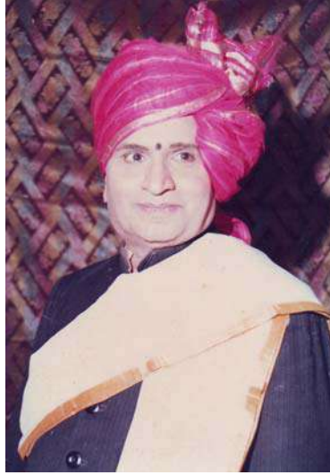
पं. राम मराठे

अखिल भारतीय कीर्तीचे घरंदाज गायक आग्रा, ग्वाल्हेर आणि जयपूर अशा तीनही घराण्यांची घराणेदारी, तालीम मिळालेले व त्यातून आपली एक स्वतंत्र, तरीही परंपरागत गायकी निर्माण करणारे शास्त्रीय गायक, बालपट (चित्रपट) संगीत रंगभूमीवरील गायक नट, संगीतकार, चित्रपट पार्श्व संगीत गायक, उत्कृष्ट डावखुरे तबलावादक, (उ. मिरखवां बाज!), बंदिश रचनाकार, आकाशवाणीचे Top Grade अति उच्च श्रेणी शास्त्रीय गायक म्हणून तमाम रसिकांमध्ये मान मिळवलेले, अत्यंत निगवीं, विनम्र, शांत स्वभावाचे असे महान गायक म्हणजे अर्थातच, संगीतभूषण पं. राम मराठे! गानगुरु सवाई, गंधर्वानंतर रामभाऊ हे नाव फक्त पं. रामभाऊ मराठे हेच कायम स्मरणात रसिकांच्या आहे आणि राहिल!