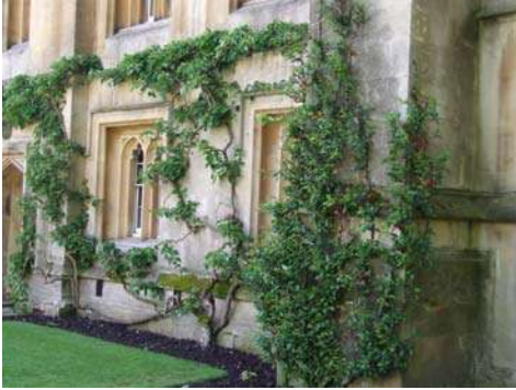
कॉलेजची दगडी इमारत

ऑक्सफर्ड भेटीत एखाद्या कॉलेजला भेट देता आली, तर चांगले होईल अशी इच्छा सहलीत सहभागी झालेल्या विद्यार्थ्यांनी व्यक्त केली. ऑक्सफर्डमधील काही कॉलेजमध्ये शुल्क आकारून आत प्रवेश देतात. पण अशा पध्दतीने आत जाऊन आपल्या हाती फारसे लागत नाही. कॉलेजमध्ये लॉन आणि दगडी इमारती एवढेच आपल्याला बाहेरून पाहता येते. म्हणून औपचारिक परवानगी घेऊन एखाद्या कॉलेजमध्ये जाता आले तर चांगले; असा विचार आम्ही करीत होतो. योगायोगाने ऑक्सफर्डमध्ये शिकलेल्या भारतीय वंशाच्या एका व्यक्तीशी आमची ओळख झाली. तू कुठे शिकलास असे चारले असता “हर्टफर्ड कॉलेज” असे उत्तर त्याने अभिमानाने दिले. ह्याचबरोबर कॉलेजबद्दल थोडी माहितीदेखील त्याने दिली. त्यावर कॉलेजला भेट देण्याची इच्छा आम्ही व्यक्त केली. तसे पाहता कॉलेजचे शिक्षण संपून त्याला बरीच वर्षे झाली होती. तरीही माजी विद्यार्थी म्हणून त्याला कॉलेजमध्ये प्रवेश होता. त्याचा उपयोग करून त्याने कॉलेजमधल्या आंतरराष्ट्रीय विभागात काम करणाऱ्या अधिकाऱ्यांना गाठले.