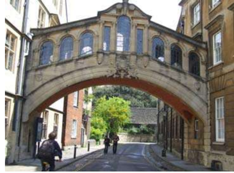
न्यू ब्रिज : हर्टफर्डच्या दोन इमारतींना जोडणारा पूल

भारतातून विद्यार्थ्यांचा गट आलेला असून तो आपल्या कॉलेजला भेट देऊ इच्छितो, असे त्याने सांगितले. त्यांच्या विनंतीवरून आम्हांला भेटीची परवानगी मिळाली. ही भेट खरोखरच संस्मरणीय अशीच होती. ठरल्याप्रमाणे सकाळी नऊ वाजता आम्ही हर्टफर्ड कॉलेजच्या प्रवेश द्वारापाशी पोहचलो. आंतरराष्ट्रीय विभागात काम करणारी एक बाई आमची वाटच पाहात होती. तिने आमचे स्वागत केले आणि एका सभागृहात नेले. तेथे चित्रफितीच्या मदतीने तिने आम्हांला कॉलेजची माहिती दिली. हर्टफर्ड नावाच्या दानशूर व्यक्तीने कॉलेज उभारण्यासाठी मोठी देणगी दिली, म्हणून त्याचेच नाव या कॉलेजला देण्यात आले आहे. तेराव्या शतकात या कॉलेजची स्थापना करण्यात आली. ज्या दगडी इमारतीत आम्ही बसलो होतो, ती ७०० वर्षांहून जुनी आहे. ही जागा अपुरी पडायला लगली म्हणून बाजूलाच नवीन इमारत बांधली. ती रस्त्याच्या दुसऱ्या बाजूला असल्याने एका इमारतीतून दुसऱ्या इमारतीत जाण्यासाठी एक पूल बांधावा लागला. न्यू ब्रीज म्हणून हा पूल ऑक्सफर्ड शहरात प्रसिध्द आहे.