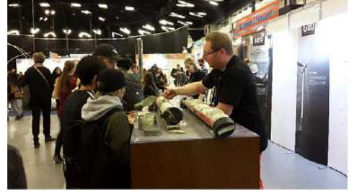
खडकांची माहिती देणारे वैज्ञानिक

प्रदर्शन तेथे भरविण्यात आले होते. त्याची माहिती देण्याचे काम एक भूगर्भ शास्त्रज्ञ करत होते. रेड क्रॉस ही एक आंतरराष्ट्रीय संस्था आहे. युद्धात जखमी झालेल्या सैनिकांना ही संस्था मदत करते. या संस्थेचे कार्य समजावून देण्यासाठी तेथे एक स्टॉल होता. अशा रीतीने अनेक विषयांवर माहिती देण्याचा प्रदर्शनात प्रयत्न केला होता.