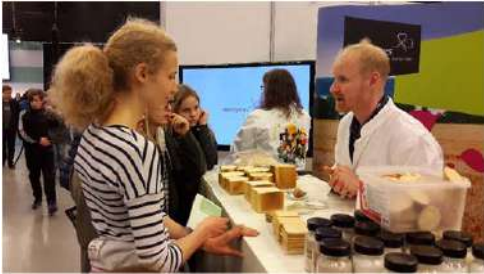
एंझाईमची माहिती देणारे वैज्ञानिक

डीटीयू बरोबरच रॉसकिलड विद्यापीठाने देखील आपला स्टॉल उभारला होता. मला सगळ्यात आश्चर्य वाटले जेव्हा मी उद्योग करणाऱ्या कंपन्यांनी उभारलेले स्टॉल पाहिले तेव्हा. डॅनफॉस ही देशातील प्रसिद्ध अभियांत्रिकी कंपनी आहे. या कंपनीने देखील एक स्टॉल उभारला होता. तेथे कंपनी करित असलेल्या उत्पादनांची माहिती तर दिली होतीच, त्याचबरोबर तरुण संशोधकांना तेथे कोणत्या संधी आहेत याची माहिती उपलब्ध करून दिली होती. मोनोझाईम ही आणखी एक कंपनी. एंझाईमच्या मदतीने ते अनेक खाद्य पदार्थ तयार करतात. त्या सगळ्यांची माहिती आणि एंझाईमच्या आपल्या जीवनातील महत्त्व या स्टॉलवर समजावून सांगितले जात होते.