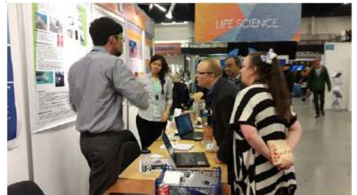
ठाण्याचे विद्यार्थी आपला प्रकल्प समजावून देताना

त्यांना नेमून दिलेल्या जागेत तरुण शास्त्रज्ञांनी आपापले प्रकल्प लावले होते. डेन्मार्क मधील निवडलेले १०० प्रकल्प या प्रदर्शनात समाविष्ट केले होते. या खेरीज भारत, ब्राजील, हॉलंड आणि चीन या देशांतून आणलेले प्रकल्प होते. भारत, ब्राजील आणि हॉलंड या देशाचे प्रत्येकी एकेक प्रकल्प होते तर चीनने चार प्रकल्प आणले होते. या सर्व प्रकल्पांचे दुसऱ्या दिवशी मूल्यमापन करण्यात आले. त्यावेळी फक्त विद्यार्थ्यांनाच सभागृहात ठेवण्यात आले. त्यांच्याबरोबर आलेल्या मार्गदर्शकांना बाहेर जाण्यासाठी मोकळा वेळ देण्यात आला होता. या संधीचा फायदा घेऊन मी कोपनहेगन शहराच्या उत्तर भागात फेरफटका मारून आलो.