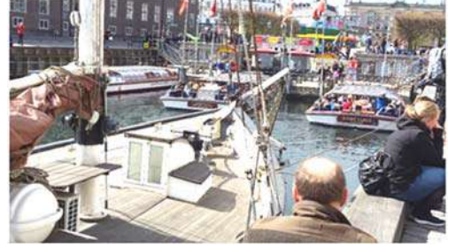
कालव्याच्या मुखाजवळ बोटींची गर्दी

होतो. आतापर्यंत इमारतींनी वेढलेल्या जागेत फिरत होतो. त्यामुळे थंडी फारशी जाणवली नाही. परंतु आता उघड्यावर गार वारा अंगाला लागत असल्याने बोचरी थंडी जाणवू लागली होती. त्यापासून संरक्षण करण्यासाठी एखादा आडोसा शोधणे आवश्यक होते. अशी एक जागा शोधून मी अर्धा तास घालवला आणि ठरलेल्या वेळी सगळ्यांमध्ये सामील झालो.