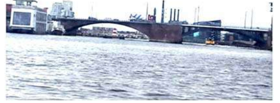
खाडीवरील एक पूल

बोटीचा प्रवास साधारणपणे एक तास चालला. शहरात वळणे घेत खाडी पसरली आहे. त्याच्या वेगवेगळ्या शाखांचे दर्शन होईल अशा पद्धतीने बोटीचा मार्ग आखलेला आहे. या प्रवासात आमची बोट अनेक प्रकारच्या पुलांखालून गेली. काही पूल रूंद तर काही कमी रुंदीचे होते. तसेच काही लांबलचक तर काही कमी लांबीचे होते. प्रत्येक पुलाची रचना वेगवेगळ्या पद्धतीने केलेली होती. बांधकाम शास्त्रातील अभ्यासकाला हे पूल प्रत्यक्ष पाहणे म्हणजे एक पर्वणीच ठरावी एवढी त्यात विविधता होती. नमुन्यादाखल एका पुलाचा फोटो खाली दिला आहेत.