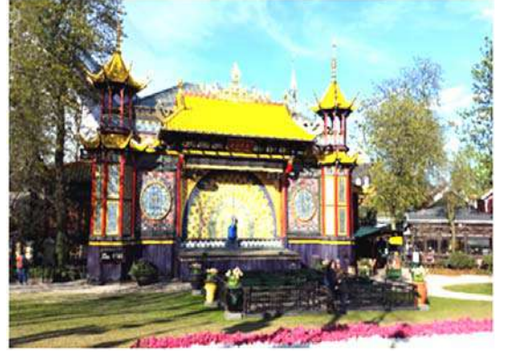
पार्कमधील नाटकाचा स्टेज

वेगवान गाड्या अशा अनेक गोष्टी त्या पार्क मध्ये होत्या. त्याचा आस्वाद तरुण मंडळींनी घेतला. त्यांच्या सोबत आलेल्या वयस्कर मंडळींनी मात्र त्यांना झेपतील अशी ठिकाणे शोधली. त्या पार्क मध्ये नाटकाचे स्टेज उभारण्यात आले होते. त्या स्टेजवर नाटकांचे लहान लहान प्रवेश दाखविले जातात. या खेरीज काही संग्रहालये देखील तेथे होती. तेथे वयस्कर मंडळींनी आपला वेळ घालविणे पसंद केले. अशा प्रकारे आमच्या गटातील लहान थोर सर्वांनीच या पार्कचा आनंद लुटला.