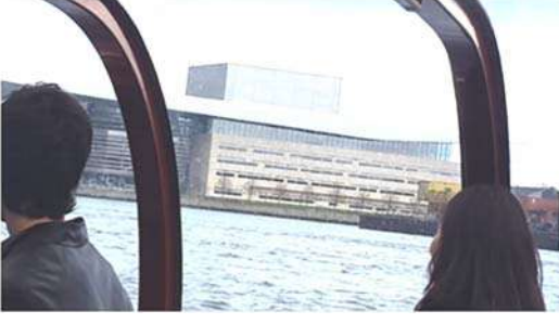
खाडीकिनाऱ्यावर असलेल्या इमारती

काही अंतर गेल्यावर आम्ही आधी पाहिलेली ऑपेरा हाउसची इमारत दिसू लागली. आता मात्र आम्ही त्या इमारतीच्या अगदी जवळ होतो. आमच्यापैकी सर्वांनीच या इमारतीचे फोटो काढले. त्याहीपेक्षा कॅमेऱ्याचा जास्त वापर तेव्हा झाला जेव्हा आम्ही लिटल मरमेड या पुतळ्याजवळ पोहोचलो. हा पुतळा ब्रॉन्झचा असून कोपनहेगन शहराची ओळख आहे. अॅन्डरसन नावाचे एक प्रथितयश डॅनिश लेखक होते. त्यांनी काही वर्षांपूर्वी एक कादम्बरी लिहिली होती. या कादम्बरीच्या पात्रावर आधारित एडवर्ड एरिक्सन या मूर्तीकाराने १९१३ मध्ये हा पुतळा बनविला. काही वर्षांपूर्वी या पुतळ्याची मोडतोड करण्यात आली होती. परंतु लवकरच त्याची डागडुजी करून त्याला मूळ स्वरूपात आणून ठेवले आहे. या पुतळ्याजवळ अनेक पर्यटकांनी आधीच गर्दी करून ठेवली होती. त्या ठिकाणाचे महत्त्व ओळखून आमच्या बोट चालकाने बोट काही क्षणासाठी पुतळ्याजवळ थांबवली. त्यामुळे आम्हा सगळ्यांना तेथे फोटो काढता आले.