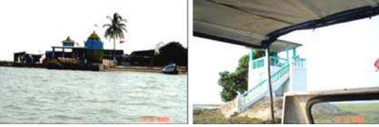
कालीजय मंदिर पक्षी निरीक्षण घर, नालबन

सभोवताली सर्व पाणथळ भाग दिसत होता. कुठे कुठे जमिनीत रोवलेल्या बांबूची टोके वर दिसत. त्यावर पाण्यात बुडी मारून नुकतीच माशाची शिकार साधलेले पाणकावळे पंख सुकवताना दिसत. या व्यतिरिक्त एक मोठा करकोचा आणि एक भला थोरला बगळाच काय तो पाहाता आला. नाही म्हणायला छोटे छोटे पक्षी, टिटव्या दर्शन देत होत्याच. जानेवारीत इथे स्थानांतर करणारे लाखो पक्षी येतात, असे जरी सारखे ऐकत आलेलो असलो तरी सध्या ऑक्टोबर अखेरीस मात्र अगदीच तुरळक आणि लहान सहान पक्षी आसपास दिसून येत होते.