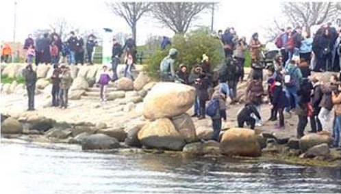
लिटल मरमेडचा पुतळा

काही अंतर गेल्यावर आम्ही आधी पाहिलेली ऑपेरा हाउसची इमारत दिसू लागली. आता मात्र आम्ही त्या इमारतीच्या अगदी जवळ होतो. आमच्यापैकी सर्वांनीच या इमारतीचे फोटो काढले. त्याहीपेक्षा कॅमेऱ्याचा जास्त वापर तेव्हा झाला जेव्हा आम्ही लिटल मरमेड या पुतळ्याजवळ पोहोचलो. हा पुतळा ब्रॉन्झचा असून कोपनहेगन शहराची ओळख आहे. अॅन्डरसन नावाचे एक प्रथितयश डॅनिश लेखक होते. त्यांनी काही वर्षांपूर्वी एक कादम्बरी लिहिली होती. या कादम्बरीच्या पात्रावर आधारित एडवर्ड एरिक्सन या मूर्तीकाराने १९१३ मध्ये हा पुतळा बनविला. काही वर्षांपूर्वी या पुतळ्याची मोडतोड करण्यात आली होती. परंतु लवकरच त्याची डागडुजी करून त्याला मूळ स्वरूपात आणून ठेवले आहे. या पुतळ्याजवळ अनेक पर्यटकांनी आधीच गर्दी करून ठेवली होती. त्या ठिकाणाचे महत्त्व ओळखून आमच्या बोट चालकाने बोट काही क्षणासाठी पुतळ्याजवळ थांबवली. त्यामुळे आम्हा सगळ्यांना तेथे फोटो काढता आले.