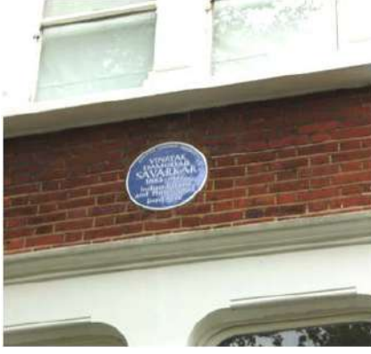
इंडिया हाऊसवर असलेला 'नील फलक'

मे २०१६ मध्ये विद्या प्रसारक मंडळ, ठाणे यांच्या वतीने शैक्षणिक सहल आयोजित करण्यात आली होती. या सहलीत विद्यार्थी, शिक्षक आणि पालक असे सगळे मिळून २४ जण होते. या सगळ्यांना घेऊन आम्ही इंडिया हाऊसला भेट द्यायला गेलो. खरे तर आम्हाला त्यांच्या जन्मदिवशी म्हणजे २८ मेलाच तिथे जायचे होते. परंतु त्यादिवशी दुसरे काम असल्याने दोन दिवस आधीच आम्ही इंडिया हाऊसला भेट देऊन आलो. आमच्या राहण्याच्या ठिकाणाहून इंडिया हाऊस जरा दूरच होते. त्यासाठी आम्ही प्रथम भुयारी रेल्वेने आर्चवे स्टेशनपर्यंत गेलो. त्यानंतर सिटी बसने क्रॉमवेल एवेन्यू जिथे सुरू होतो तिथपर्यंत गेलो. पुढचा प्रवास आम्ही पायीच केला. हा रस्ता जरा वळणाचा आणि चढ असलेला आहे. दोन्ही बाजूला बहुमजली कौलारू घरे आणि त्यामधून जाणारा अरुंद रस्ता असे ते चित्र होते. हळूहळू पावले टाकत आम्ही इंडिया हाऊस जवळ पोहोचलो. रस्त्याच्या दुसऱ्या बाजूला उभे राहून ती वास्तू आणि त्यावरील फलक आम्ही सर्वांना दाखविला. त्यानिमित्ताने सावरकरांचे कार्य त्यांनी स्वातंत्र्य प्राप्तीसाठी केलेले प्रयत्न आणि समाज सुधारणेसाठी घेतलेले परिश्रम यांची माहिती दिली.