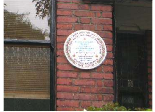
शामजींच्या घरावर असलेला फलक

किलोमीटर पुढे जाऊन उतरलो. थोडे चालल्यावर आम्ही इच्छित स्थळी पोहोचलो. शामजी जेथे राहात त्या घरावर देखील फलक लावलेला आहे. परंतु हा फलक लंडन कौन्सिलने लावला नसून काही भारतीय लोकांनी लावलेला आहे. त्यामुळे, त्याचा आकार आणि रंग दोन्ही नील फलकाहून वेगळे होते. या फलकाचे चित्र खाली दिलेले आहे.