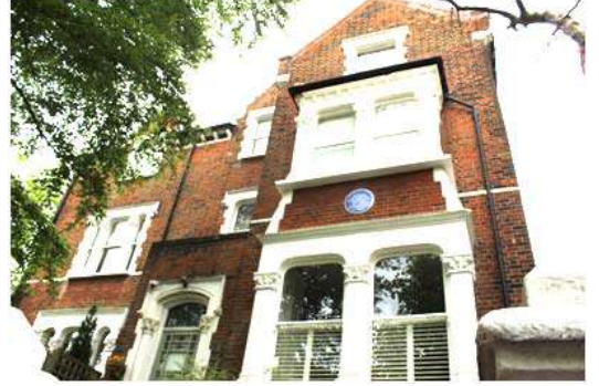
इंडिया हाऊसची सुबक इमारत

इंडिया हाऊसला आवर्जून भेट देतो. ‘६५ कॉमवेल एवेन्यू’ असा या घराचा पत्ता आहे. तेथे जाऊन आम्ही सावरकरांच्या कामाची माहिती देतो. सावरकरांनी देशासाठी मोठे बलिदान दिलेले आहे त्याची माहिती नवीन पिढीला होणे महत्त्वाचे आहे.