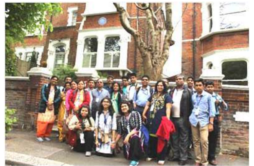
इंडिया हाऊससमोर काढलेला ग्रुप फोटो

प्रयत्न करू लागले. आम्हाला मात्र त्यांना थांबवावे लागले. याचे कारण ही इमारत सध्या खाजगी मालकीची आहे. शामजीनी १९०५ मध्ये ही इमारत घेतली. वसतीगृह चांगल्या तऱ्हेने चालले होते. अनेक भारतीय विद्यार्थी या सुविधेचा फायदा घेऊ लागले होते. परंतु १९०७ मध्ये एकंदर परिस्थिती बदलल्यामुळे त्यांना लंडन सोडून पॅरिसला जावे लागले. पॅरिसला देखील त्यांना राहणे कठीण झाले. म्हणून ते जिनिवाला गेले. तिथेच १९३० साली त्यांच्या मृत्यू झाला. त्यांच्या पश्चात या वास्तूची देखभाल करणारे कोणी राहिले नाही. त्याहीपेक्षा महत्त्वाची घटना १९०९ च्या जुलै महिन्यात घडली. याच वसतिगृहात राहणारे मदनलाल धिंग्रा यानी सर कर्झन वायली यांचा गोळ्या झाडून खून केला. त्यामुळे इंडिया हाऊस स्कॉटलंड यार्डच्या नजरेत आले. येथे चालणाऱ्या घडामोडींवर आधीच त्यांचे लक्ष होते. वायली यांच्या खुनानंतर या घराची आणि तेथे राहणाऱ्या लोकांची झाडाझडती सुरू झाली. इंग्रज अधिकाऱ्यांच्या वक्रदृष्टीमुळे हे वसतीगृह चालविणे कठीण झाले. भारतातून येणाऱ्या विद्यार्थ्यांकडून मिळणारा प्रतिसाद देखील कमी झाला. त्यामुळे इंडिया हाऊस विकावे लागले. १९१० मध्ये रीतसर विक्री होऊन हे घर एका इंग्रज माणसाच्या ताब्यात गेले. त्यामुळे घरात जाऊन ते आतून बघण्याची इच्छा आम्हाला दाबून ठेवावी लागली. परंतु आम्ही घरासमोर एक ग्रुप फोटो मात्र काढून घेतला.