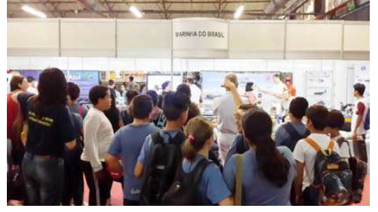
धृवीय प्रदेशात संशोधन करणाऱ्या संस्थेचा गजबजलेला स्टॉल

मोस्ट्राटेकला भेट देणाऱ्या लोकांना शाळकरी विद्यार्थ्यांच्या प्रकल्पाबरोबरच देशात चाललेल्या संशोधन कार्याची माहिती व्हावी असा आयोजकांचा प्रयत्न असतो. त्यासाठी देशातील काही शैक्षणिक आणि संशोधन संस्थांना ते प्रदर्शनासाठी पाचारण करतात. त्यांच्या संस्थेबद्दल माहिती देण्यासाठी लागणारी सुविधा आणि जागा त्यांना उपलब्ध करून दिली जाते. त्यामध्ये फंडासव लिबरटो या संस्थेचा एक स्टॉल असतोच. याखेरीज इतर काही संस्थांचे स्टॉल असतात. बत्तीसाव्या मोस्ट्राटेकचे वैशिष्ट्य हे की, तेथे दक्षिण ध्रुवावर संशोधन करणाऱ्या संस्थेचा स्टॉल होता. या स्टॉलमध्ये या संशोधनाची सुरुवात कशी झाली यापासून सद्यस्थितीत कोणते संशोधन केले जात आहे याची माहिती दिलेली होती. त्यासाठी त्या संस्थेत काम करणारे संशोधक तिथे आले होते. प्रत्यक्ष संशोधकांकडून माहिती मिळत असल्याने या स्टॉलजवळ सतत गर्दी असायची.