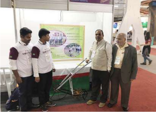
भारतातून नेलेले प्रदर्शनीय उपकरण

एक यंत्र विकसित केले. तेच यंत्र घेऊन हे विद्यार्थी स्पर्धेला आले होते. विषय साधाच होता पण शेतकऱ्यांचा जिव्हाळ्याचा होता. शेतीत पिकणाऱ्या धान्यावर आपण सगळेजण अवलंबून असल्याने या विषयात सगळ्यांनाच रस होता. त्यामुळे प्रदर्शन पाहायला येणाऱ्या अनेक लोकांनी या प्रकल्पाजवळ गर्दी केली.