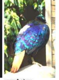
राज्यपक्षी मोनाल राज्यपशु कस्तुरीमृग (मस्क टिअर)