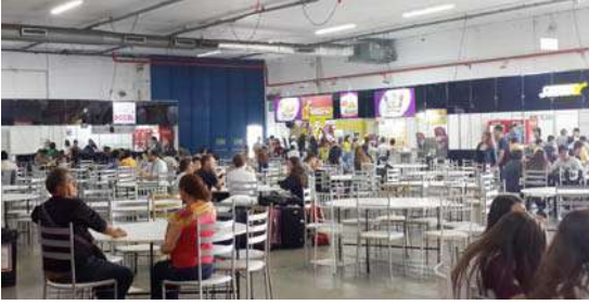
तळमजल्यावरील भोजन व्यवस्था

असे करण्यात आले आहे. बत्तीसाव्या मोस्ट्राटेकचे आयोजन याच संकुलात करण्यात आले होते. दोन मजल्यांवर पसरलेल्या या संकुलात प्रदर्शनीय वस्तू ठेवण्यासाठी पुरेशी जागा आहे. त्याचबरोबर संकुलात एक मोठे सभागृह आणि छोट्या गटाला चर्चेसाठी उपयोगी पडतील अशा लहानलहान खोल्या आहेत. मोठ्या संख्येने लोक प्रदर्शन पाहायला येणार म्हणून त्यांच्या खाण्यापिण्याची सोय व्हावी यासाठी खाद्यपदार्थांचे पुरेसे स्टॉल उभारता येतील अशी व्यवस्था केलेली आहे. सोयीसाठी तळमजल्यावर खाण्याची सोय आणि पहिल्या मजल्यावर प्रदर्शन अशी विभागणी करण्यात आली होती.