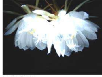
राज्यपुष्प बन्टुकमळ राज्यवृक्ष बुरांस (दोडोडेन्ड्रॉन)

भागिरथी (गंगा), अलकनंदा, मंदाकिनी, पिंडारी, तोन्स, यमुना, काली, न्यार, भिलंगन, शरयू आणि रामगंगा ह्या नद्या या राज्यातून वाहतात. थोडक्यात काय, तर गंगा-यमुनेच्या खोऱ्यांचे डोंगराळ भागातून मैदानी भागात अवतरण होते तेच हे विख्यात स्थान आहे. गहू, तांदूळ, बार्ली, मका, मंडुआ, हंगोरा इत्यादी पीके इथे घेतली जातात. सफरचंद, लिची, आलुबुखार, नास्पती इत्यादी फळेही इथे होत असतात. चुनखडी,