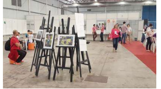
मुलांनी आणि शिक्षकांनी काढलेल्या चित्रांचे प्रदर्शन

मोस्ट्राटेक ही प्रामुख्याने विज्ञान आणि तंत्रज्ञानाची स्पर्धा असते. असे असले तरी त्यातील प्रत्येक प्रदर्शनीय वस्तूचा विज्ञान किंवा तंत्रज्ञानाशी संबंध असलाच पाहिजे असे नाही. विज्ञानाबरोबरच कला क्षेत्राला देखील या प्रदर्शनात सारखेच महत्त्व दिलेले तेथे आढळते. प्रदर्शनात सर्वत्र छान छान चित्रे लावून ठेवलेली असतात. याखेरीज विद्यार्थ्यांनी गोळा केलेल्या वस्तू, त्यांनी बनविलेल्या बाहुल्या, खेळण्या यांनादेखील या प्रदर्शनात स्थान दिलेले होते. काही ठिकाणी तर पेंटिंग्जचेच प्रदर्शन भरविलेले आढळले.