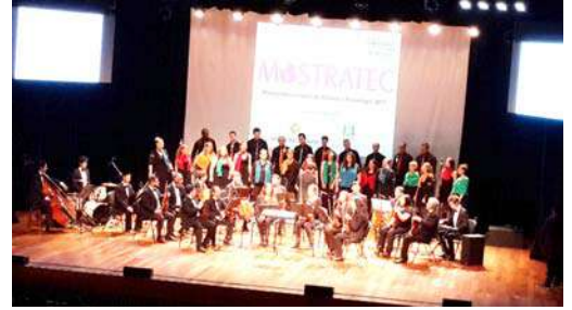
फंडासाव लिबॅरटो संस्थेचा बँड

हा कार्यक्रम प्रदर्शनाच्या ठिकाणीच आयोजित केला होता. मोठ्या मुलांसाठी मात्र हा कार्यक्रम गावातल्याच फीवेल विद्यापीठाच्या सभागृहात (Feevale University Hall) आयोजित केला होता. डोंगरांनी वेढलेल्या या विद्यापीठाचे सभागृह खूप मोठे असून त्यात सर्व आधुनिक सुविधा आहेत. कार्यक्रमाची सुरुवात फंडासाव लिबॅरटो संस्थेच्या बँड पथकाने केली. कानाला गोड आणि मनाला मोहून घेईल असे गीत सादर करून त्यांनी योग्य वातावरण निर्मिती केली.