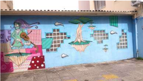
भिंतीवरील आकर्षक चित्र

कॅम्पो बोम उपनगरातून आमची बस थोड्याच अवधीत नोव्हो हॅम्बुर्गो शहरात आली. हे शहर सपाट जमिनीवर नसून उंचसखल भागात वसलेले आहे. रोज आमचा प्रवास हॉटेल ते प्रदर्शन स्थळ असाच असायचा. त्यामुळे शहर कसे आहे आहे याची आम्हाला पुरेशी कल्पना आलेली नव्हती. या निमित्ताने शहर पाहण्याची संधी आम्हाला मिळली. शहर लहान आणि रस्ते मोठे असल्याने वाहतुकीची कोंडी झालेली आम्हाला कुठेही पाहायला मिळाली नाही. लवकरच आम्ही शहर पार करून शहराच्या वेशीवर पोहोचलो. त्यावेळेस आमच्या बसने मुख्य रस्ता सोडला आणि डोंगरावर जाणारा एक वळणावळणाचा रस्ता घेतला. या रस्त्याच्या दोन्ही बाजूला टूमदार असे बंगले होते. सर्वत्र स्वच्छता होती. टेकडीवरून शहर सुंदर दिसत होते. हे पाहण्यात आम्ही एवढे दंग झालो होतो की आमची बस कधी टेकडीवर पोहोचली तेच आम्हाला कळले नाही. बस थांबल्यावर