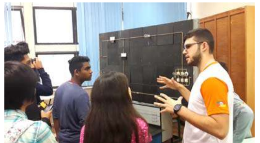
इलेक्ट्रीकल इंजिनिअरिंग विभागातील आंतरक्रिया

मेकॅनिकल इंजिनिअरिंग विभागातून बाहेर पडून आम्ही इलेक्ट्रीकल इंजिनिअरिंग (Electrical Engineering) या विभागात गेलो. तेथे माहिती देण्यासाठी काहीजण उपस्थित होते. त्यांनी या विभागात काय शिकवले जाते याची माहिती दिली. त्यांनी सांगितले की येथे येणाऱ्या विद्यार्थ्यांला प्रथम या क्षेत्रात वापरल्या जाणाऱ्या साहित्यांची माहिती देण्यात येते. त्यानंतर त्यांना अगदी साध्या सर्किटची माहिती देतात. येथे प्रात्यक्षिकांवर भर दिला जातो. त्यासाठीच सुसज्ज अशा प्रयोगशाळा त्यांनी उभारलेल्या आहेत.