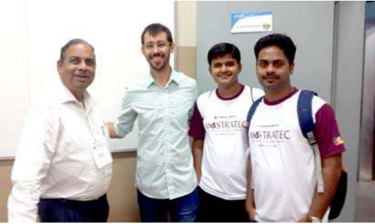
संस्थेच्या माजी विद्यार्थ्यांसोबत घेतलेले छायाचित्र

इलेक्ट्रीकल इंजिनिअरिंग विभागातून बाहेर पडेपर्यंत दुपार झाली होती. आमची हॉटेलला परत जाण्याची वेळ होत आली होती. त्यामुळे बघण्यासारखे बरेच काही असूनदेखील आम्ही संस्थेतून काढता पाय घेतला. तरीही आमची नजर केमिकल इंजिनिअरिंग (Chemical Engineering) विभागाकडे गेली. म्हणून तिथे डोकावून यायचे आम्ही ठरविले. आम्ही तेथे पोहोचलो तर एक माणूस आम्हाला दारातच भेटला. त्याने आम्हाला सांगितले की तो या तंत्रनिकेतनचा माजी विद्यार्थी आहे. त्यांनी या संस्थेत जे काही ज्ञान घेतले त्याचा त्याला जीवनात खूप उपयोग झाला. या संस्थेतून बाहेर पडल्यावर त्याने एका रासायनिक कंपनीत काम केले. सध्या तो फिल्म इंडस्ट्रीमध्ये काम करतो. एका दशकापूर्वी तो या संस्थेतून बाहेर पडला. तरीही त्याला या संस्थेबद्दल अजूनही आस्था आहे. त्याने आम्हाला सांगितले की, काही आंतरराष्ट्रीय पाहुणे संस्थेला भेट द्यायला येणार आहेत असे त्याला कळले. म्हणून तो आठवणीने तेथे आला. त्याच्याशी बातचीत करून आम्हाला संस्थेच्या कार्याची चांगलीच माहिती मिळाली. म्हणून आम्ही त्याच्याबरोबर एक छायाचित्र काढून घेतले.