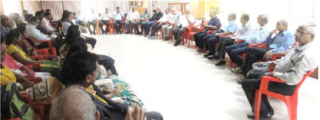
महाविद्यालयाच्या भेटी दरम्यान उपस्थितांना मार्गदर्शन करताना संस्थेच्या वरिष्ठ शास्त्रज्ञ परिषदेचे सदस्य