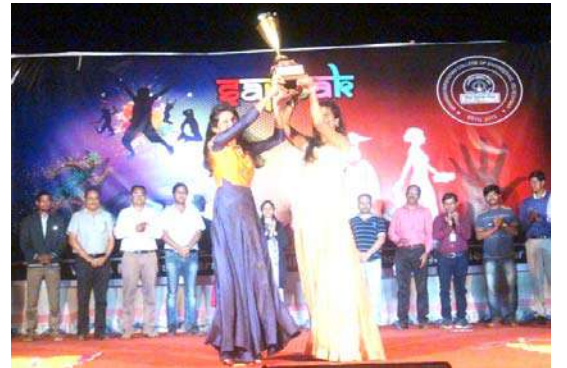
महाविद्यालयाचा वार्षिक स्नेहसंमेलन 'सप्तक २०१८'

अशाप्रकारे विविध सांघिक व वैयक्तिक स्पर्धेत चमकदार कामगिरी करणाऱ्या सर्व विद्यार्थ्यांना प्रशस्तीपत्रक व विविध बक्षिसे देऊन सन्मानित करण्यात आले.