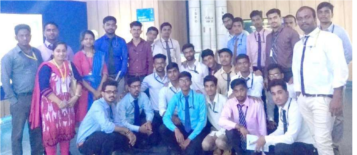
महाविद्यालयातील विद्युत अभियांत्रिकीच्या विद्यार्थ्यांची इस्रो संशोधन केंद्रास भेट

महाविद्यालयातील फायर साधनांचे आपत्कालीन परीस्थितीत आग लागल्यास ती कशी विझवायची आणि त्यासाठी कोणत्या फायर साधनांचा वापर करावा याचे