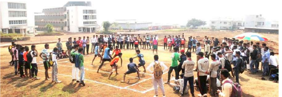
महाविद्यालयातील 'ARENA18' या क्रीडा महोत्सवात सहभागी झालेले इतर महाविद्यालयाचे विद्यार्थी.