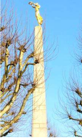
एक लक्षवेधी सोनेरी पुतळा