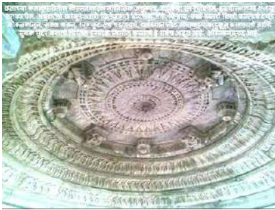
विजयस्तंभाच्या सर्वोच्च कक्षातील छतावरील नेत्रदीपक कलाकुसर

बाहेर संध्याकाळ व्हायला आलेली होती. जलमहालावर संध्याकाळचे ऊन पडून अवर्णनीय शोभा उदयास आलेली होती. आता आमच्या हातात आमचे कॅमेरेही आलेले होते. मग काय विचारता. आतापर्यंत दाबून ठेवलेली प्रकाशचित्रणाची हौस प्रत्येकाने असंख्य चित्रे काढूनच भागवून घेतली. तर कित्येकांनी मनःपूत चलतचित्रणही करून घेतले.