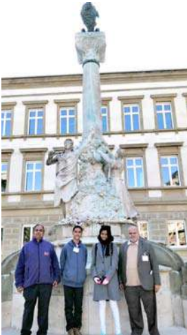
एका पुतळ्यासमोर भारतीय चमू

दिवस मावळायला आला तेव्हा त्यांनी आम्हाला तेथेच थांबायला सांगून विद्यार्थ्यांना मात्र दुसरीकडे घेऊन गेले. वेगवेगळ्या देशांतील मुलांची परस्परांशी चांगली ओळख व्हावी यासाठी त्यांनी त्यांच्यासाठी वेगळाच कार्यक्रम आखला होता. त्यामध्ये वेगवेगळे खेळ समाविष्ट होते. या खेळाच्या माध्यमातून विद्यार्थ्यांमध्ये जवळीक साधली जावी असा उद्देश होता. तो बऱ्याच अंशी साध्य झाला. त्यांच्या रात्रीच्या भोजनाची व्यवस्था देखील तिकडेच करण्यात आली होती. मोठ्या मंडळींच्या रात्रीच्या भोजनाची व्यवस्था मात्र शहरातच करण्यात आली होती. त्यासाठी एक चिनी भोजनालय निवडले होते. मी इकडेतिकडे बघत होतो पण मला भारतीय