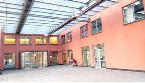
यूथ होस्टेलची इमारत

दूर असल्याने तेथे हिवाळ्यात दिवस खूपच लहान तर उन्हाळ्यात खूपच मोठा असतो. उन्हाळ्यात १६ ते १८ तास सूर्य आकाशात असतो. त्यामुळे सकाळ लवकर होते. या गोष्टीचा उपयोग करून घेण्याचे तेथील विचारवंतानी ठरविले. त्यानुसार, उन्हाळ्यात घड्याळ एका तासाने पुढे करण्याची प्रथा सुरू झाली. या प्रकारामुळे प्रत्यक्षात आठच वाजले असताना घड्याळात मात्र नऊ वाजलेले दिसतात. त्यामुळे लोक एक तास आधीच कामाला जातात. मार्च महिन्याच्या शेवटच्या रविवारी घड्याळ एका तासाने पुढे करावयाचे असते. ते घड्याळ तसेच सहा महिने राहते. ऑक्टोबर महिन्याच्या शेवटच्या रविवारी परत घड्याळ एका तासाने मागे केले जाते. हा शिरस्ता अनेक वर्षे चालू आहे. या शिरस्त्यानुसार आम्ही आपले घड्याळ लावून घेतले आणि नवीन वेळेनुसार ९ वाजता तयार झालो. लवकरच प्रदर्शनस्थळी आम्हाला नेण्यासाठी बस आली.