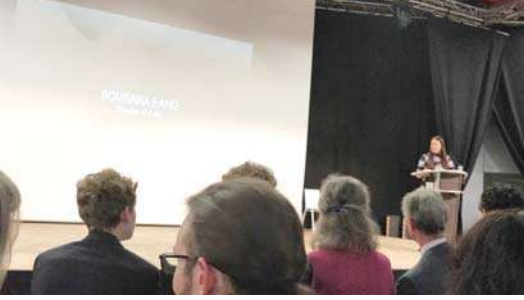
विद्यार्थ्यांना मार्गदर्शन करणारी तरुण संशोधिका

प्रकल्प सादरीकरणाचे काम दिवसभर चालू होते. मध्ये दुपारी जेवणासाठी अवकाश देण्यात आला होता. प्रत्येकाने आपल्या सोयीनुसार आपले पाकीट घेऊन जेवण आटोपून घ्यावे अशी सूचना आधीच दिली होती. संध्याकाळी बक्षीस वितरणाचा कार्यक्रम होता. त्यासाठी त्या देशाचे राजे आले होते. काही बडेजाव नाही की मोठा गोतावळा नाही. संपूर्ण कार्यक्रमाला ते हजर होते. परंतु त्यांनी भाषण देखील केले नाही. त्याऐवजी भाषण होते ते दोन तरुण संशोधकांचे. ही कल्पना मला फारच आवडली. सहभागी झालेल्या प्रत्येक विद्यार्थ्यांने त्यांचे संशोधनाचे अनुभव अगदी लक्षपूर्वक ऐकले.