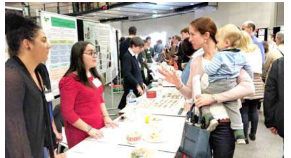
विज्ञान मेळाव्याचे दृश्य

भारतीय विद्यार्थी आपला प्रकल्प समजावून देताना फ्रान्स असे सुमारे दहा देश यात सहाभागी झाले होते. सगळेच प्रकल्प बघण्यासारखे होते. एकदा आमची मुले रुळली की मी देखील फेरफटका मारून आलो. प्रदर्शन पाहायला आलेले सानथोर सर्वचजण मन लावून प्रत्येक प्रकल्प समजावून घेत होते. विद्यार्थी प्रयत्नांची पराकाष्ठा करून आपले म्हणणे त्यांना समजावून सांगत होते. त्यामध्ये एक भारतीय वंशाचा मुलगा देखील होता. तो त्याच शहरातील शाळेत शिकतो. त्याचे वडील तेथेच एका कंपनीत कामाला आहेत. त्यामुळे त्यांचे कुटुंब याच शहरात राहते. संध्याकाळी त्याच्या आईवडिलांची त्याने भेट करून दिली. त्यांच्याकडून समजले की, हा देश कोठल्याच राजकीय गटात नसून अलिप्त आहे. व्यवसाय करण्याचे नियम येथे उद्योगधंद्याना पोषक असेच आहेत. त्यामुळे येथे अनेक आंतरराष्ट्रीय कंपन्या आहेत. विशेष म्हणजे लक्षी मित्तल यांच्या पोलाद उद्योगाचे प्रमुख कार्यालय याच शहरात आहे.