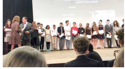
प्रमाणपत्रप्राप्त आंतरराष्ट्रीय विद्यार्थी

प्रदर्शनात सहभागी झालेल्या प्रत्येक विद्यार्थ्यांला प्रशस्तीपत्रक देण्यात आले. याखेरीज वेगवेगळ्या ठिकाणी स्पर्धेसाठी पाठवावयाच्या प्रकल्पांची निवड जाहीर करण्यात आली. हा सर्व सोहळा अतिशय पद्धतशीरपणे संपन्न झाला. विशेष असे की, या सोहळ्यात बोलण्यासाठी म्हणून भारतीय प्रतिनिधीला पाचारण करण्यात आले. मी स्टेजवर जाऊन आयोजकांचे आभार मानले. त्याचबरोबर अशाच प्रकारची स्पर्धा आम्ही विशाखापटनम येथे आयोजित करतो तेथे येण्याचे निमंत्रण दिले. त्याचा युवक शास्त्रज्ञ समितीने स्वीकार केला. यातून नियमीतपणे येणे-जाणे सुरू होण्याची शक्यता वाढली आहे.