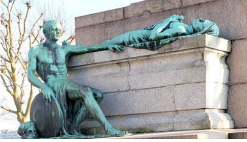
आणखी एक लक्षवेधी पुतळा