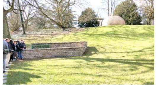
बागेतील भुयाराचे प्रवेशद्वार