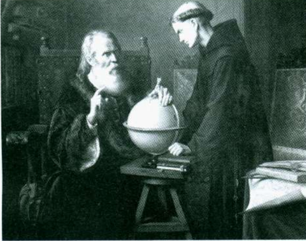
गॅलिलिओचे एक कल्पना चित्र

आधुनिक जग, हे ज्ञानाधिष्ठित (Knowledge Society) आहे असे आपण समजतो. अर्थातच इतिहासाचा अभ्यास केला तर हे विधान धाडसाचे आहे असे वाटायला लागते. जगातली कुठलीच प्रगती ही एखाद्या दशकात, शतकात, किंवा सहस्रकात झालेली नसते. अशी प्रगती ही कायमच होत असते. म्हणूनच प्रत्येक प्रगतीला भूतकाळ हा असतोच.