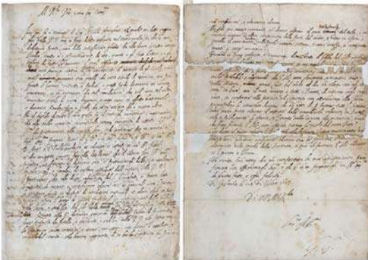
गॅलिलिओच्या हस्ताक्षरातील मूळ पत्र

विज्ञान आणि धर्मसत्ता यांच्या संघर्षामध्ये गॅलिलिओने कणखर भूमिका घेऊन विज्ञानाचीच पाठराखण केली अशी त्यांची प्रतिमा होती, आणि आहे. गेली ४०० वर्ष इतिहासाच्या संशोधकांना या दोन्ही पत्रांच्या नकला उपलब्ध होत्या, मूळ पत्र उपलब्ध नव्हते. अर्थातच गॅलिलिओ असा काही बदल करेल असे अभ्यासकांना पटत नव्हते. रॉयल सोसायटीमध्ये मिळालेले पत्र हे म्हणूनच महत्त्वाचे आहे. त्याचे महत्त्व असे आहे की, आपल्या हस्ताक्षरानीच, बेनेदेत्ते कॅसेली यांना पाठवलेल्या मूळ पत्रामध्ये काही ठिकाणी बदल करून ते सौम्य करण्याचा प्रयत्न गॅलिलिओने केलेला दिसतोय. आपल्या मूळ पत्रात बायबलमधील वचनांच्या बाबतीत गॅलिलिओ लिहितात, 'false if one goes by the literal meaning of the words'. यातला 'false' हा शब्द खोडून त्यानी 'look different from the truth'