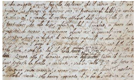
गॅलिलिओच्या पत्रात गॅलिलियोनेच केलेली खाडाखोड