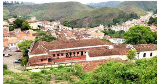
शहराचे एक मनोहारी दृश्य

या गावाला आऊरो प्रेटो असे नाव पडण्याचे कारण की, या गावाभोवती सोन्याच्या अनेक खाणी होत्या. लॅटिन भाषेत सोन्याला ऑरम (Aurum) असे म्हणतात. प्रेटो (Preto) या शब्दाचा अर्थ 'काळा' असा आहे. येथे सापडणाऱ्या सोन्यावर काळसर थर आढळत असे. म्हणून या गावाचे नाव 'आऊरो प्रेटो' म्हणजे 'काळे सोने' असे पडले. आता येथील खाणीतून सोने काढणे परवडत नाही. त्यामुळे त्या बंद करण्यात आल्या आहेत. आता येथील खाणीतून लोखंड आणि अॅल्युमिनिअम यांची खनिजे मिळविली जातात. माझ्या मित्राने सांगितले की, या खनिजावर प्रक्रीया करण्याचे काम भारतातील हिंदाल्को (Hindalco) कंपनी येथे अनेक वर्षे करत होती. आता मात्र या कंपनीने आपले काम बंद केले आहे. लक्ष्मीकांत मित्तल यांची आर्सेलर ही कंपनी अजूनही येथे लोह खनिजावर प्रक्रीया करण्याचे काम करित आहे. आजच्या घडीला हे शहर एक प्रेक्षणीय स्थळ म्हणून प्रसिद्ध आहे.