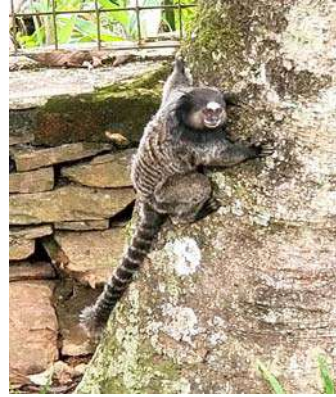
एक विचित्र माकड

आऊरो प्रेटो या शहराला दिलेली भेट माझ्या अनेक वर्षे स्मरणात राहिल अशीच होती. त्यातील सगळ्यात स्मरणात राहणारी बाब म्हणजे मी तिथे पाहिलेले एक विचित्र माकड. आम्ही शहराचा