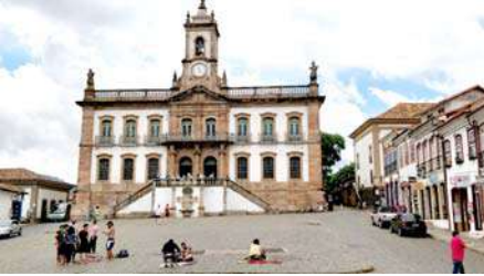
संग्रहालयाची सुबक इमारत

पोर्तुगीजांची गुलामी राजवट संपविण्यासाठी स्थानिक लोकांना अनेक वर्षे लढा द्यावा लागला. या लढ्याची माहिती देणारे एक संग्रहालय या शहरात आहे. त्याला म्युझिया डा इनकॉन्फेडेशिया (Musea de Inconfidencia) म्हणजे 'अविश्वास संग्रहालय' असे समर्पक नाव दिलेले आहे. शहराच्या मध्यवर्ती ठिकाणी एका प्रशस्त आणि सुंदर इमारतीत हे संग्रहालय आहे. स्वातंत्र्य लढ्याची कहाणी इथे उत्तम रीतीने चितारली आहे. त्यापेक्षाही अधिक महत्त्वाचे हे की, ज्या स्वातंत्र्य सैनिकांना पोर्तुगीजांनी फासावर लटकविले त्यांच्या अस्थी पुरून त्यांची थडगी येथे उभारली आहेत. या संग्रहालयाला भेट देऊन ब्राझीलच्या स्वातंत्र्य लढ्याची माहिती मिळविता येते.