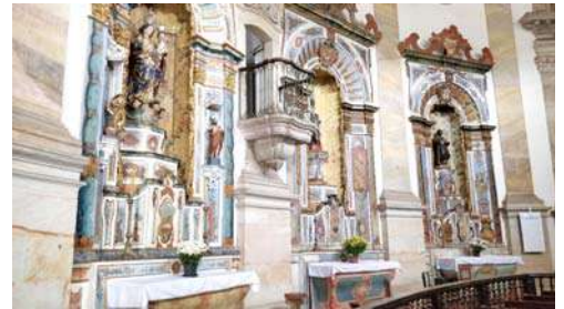
चर्चच्या आतील कलाकुसर

गावाची लोकसंख्या सुमारे सत्तर हजार आहे. तरीही गावात अनेक चर्च आहेत. धनिक मंडळींनी आपले वर्चस्व प्रस्थापित करण्यासाठी काही चर्च बांधले. या चर्चमधली आतली सजावट अतिशय आकर्षक आहे. पोर्तुगीजांनी गुलामांना ख्रिश्चन धर्मात प्रवेश करायला भाग पाडले. परंतु त्यांना युरोपियन लोकांच्या चर्चमध्ये प्रवेश नव्हता. त्यांच्यासाठी आणखी वेगळे चर्च बांधण्यात आले. त्यामुळे चर्चची संख्या वाढत गेली. आमच्या मित्रांनी मला चर्च ऑफ नोसा सेनोरा डो रोझारिओ (Church of Nossa Senhora do Rosario) पाहण्याचा आग्रह केला. त्या दोघांबरोबर मी आत जाऊन आलो. आतला भाग खूपच सुंदर रीतीने सजविला आहे.