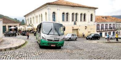
शहर वाहतुकीची बस

गावातील सार्वजनिक वाहतूक व्यवस्था उत्तम आहे. रस्ते दगडांचे, अरूंद आणि वळणावळणाचे असल्याने येथे लहान आकाराची बस चालवावी लागते. बसमध्ये प्रवेश पुढच्या बाजूने घ्यायचा असतो. दाराजवळच एका उंच खुर्चीवर कंडक्टर बसलेला किंवा बसलेली असते. तिथे तिकीट घेतल्यानंतरच आत प्रवेश करता येतो. साठ वर्षांहून अधिक वय असलेल्या व्यक्तीला बसचा प्रवास मोफत आहे. त्याचा फायदा मी शहरात फिरण्यासाठी करून घेतला.