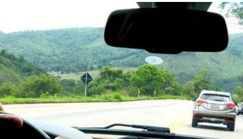
जंगलातून जाणारी सुंदर वाट

तेहतिसाव्या मोस्ट्राटेक (Mostratec) स्पर्धेत सहभागी होण्याच्या निमित्ताने आक्टोबर महिन्यात ब्राझीलला जाण्याची संधी मिळाली. ही स्पर्धा नोव्हो हम्बुर्गो नावाच्या गावात होती. स्पर्धा संपल्यानंतर मी माझ्या काही प्राध्यापक मित्रांना भेटण्यासाठी आऊरो प्रेटो (Ouro Preto) या शहरात जाऊन आलो. त्यासाठी प्रथम मला बेलो हॉरिझांटो (Belo Horizonte) नावाच्या गावी विमानाने जायला लागले. तेथून पुढे १५० किलोमीटरवर आऊरो प्रेटो हे गाव आहे. हा प्रवास मी टॅक्सीने केला. संपूर्ण प्रवास जंगलातून करावा लागला. कोठेही सपाट जमीन नाही की शेती व्यवसाय नाही. रस्त्याला अनेक वळणे आहेत. रस्ता मात्र रुंद आणि चांगल्या स्थितीत आहे. त्यामुळे प्रवास सुखकर होतो. दोन तासांचा प्रवास करून मी इच्छित स्थळी पोहोचलो. तिथे पोहोचल्यावर असे लक्षात आले की, आऊरो प्रेटो हे सर्व बाजूंनी डोंगरानी वेढलेले हे एक सुंदर शहर आहे. तिथे काही दिवस राहिल्यानंतर या शहराबद्दल खूपच मनोरंजक माहिती मिळाली. दिशा मासिकाच्या वाचकांसाठी ती सगळी माहिती या लेखात देत आहे.