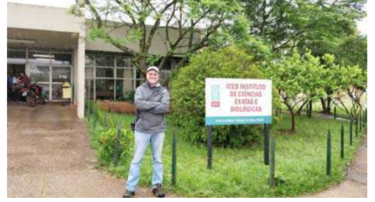
विद्यापीठाची मुख्य इमारत

मिळविण्यासाठी एक कठीण परीक्षा द्यावी लागते. आजूबाजूच्या अनेक देशातील विद्यार्थी शिक्षण घेण्यासाठी या विद्यापीठात येतात.