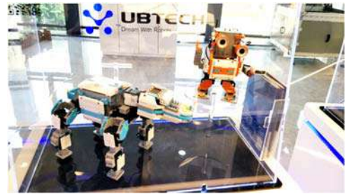
आदेश पाळणारे रोबो

चाँगचिंग हे एक औद्योगिक शहर आहे. येथे लॅपटॉप आणि रोबो मोठ्या संख्येने बनविले जातात. त्यापैकी रोबो बनविणाऱ्या कारखान्याला भेट देण्याची आम्हाला संधी मिळाली. त्यासाठी आम्हाला गावाच्या बाहेर असलेल्या एका औद्योगिक क्षेत्रात घेऊन गेले. विस्तीर्ण अशा परिसरात पसरलेल्या या औद्योगिक क्षेत्रात अनेक प्रकारचे कारखाने आहेत. त्यातील रोबोच्या कारखान्यासमोर आमची बस थांबली. या कारखान्याच्या पहिल्या मजल्यावर रोबोचे प्रदर्शन आहे. ते बघण्यासाठी