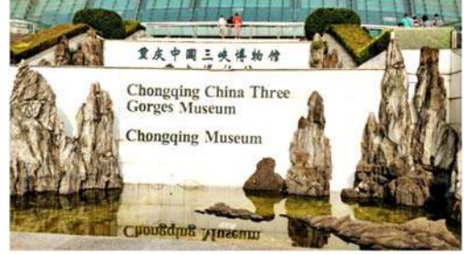
श्री गोर्जेस संग्रहालय

संग्रहालय (Three Gorges Museum) बनविण्यात आले आहे. या संग्रहालयाला भेट देण्याची आम्हाला संधी मिळाली. एका प्रशस्त अशा बहुमजली इमारतीत हे संग्रहालय आहे. या संग्रहालयाच्या भेटीवर एक स्वतंत्र लेख लिहावा लागेल.