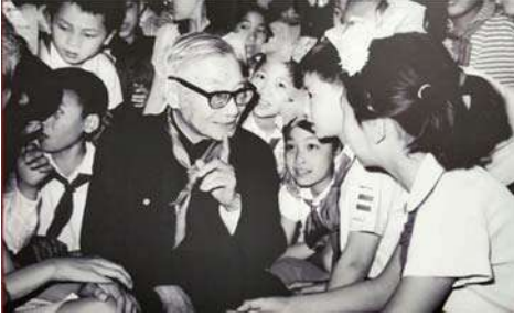
वयोवृद्ध शास्त्रज्ञ शाळकरी मुलांशी गप्पा मारताना

शास्त्रज्ञ आणि तंत्रज्ञ या संस्थेशी जोडले गेले. या संस्थेने देशाच्या विकासात मोलाची कामगिरी बजावली. या संस्थेचे सामाजिक कार्य देखील मोठे आहे. समाजात वैज्ञानिक जागृती करण्यासाठी तसेच विद्यार्थ्यांमधे विज्ञानाची आवड निर्माण करण्यासाठी या संस्थेच्यावतीने विविध कार्यक्रम राबविले जातात. या सगळ्या कार्यक्रमांची माहिती देणारे प्रदर्शन एका दालनात भरविले होते. या दालनातून फेरफटका मारला की या संस्थेच्या कामाचा आवाका आपल्या लक्षात येतो. संस्थेने राबविलेल्या विविध कामांची माहिती या प्रदर्शनात चित्ररूपात दिलेली आहे. त्यातील एक बोलके चित्र खाली दिलेले आहे. एक वयस्कर शास्त्रज्ञ शाळकरी मुलांशी संवाद साधताना घेतलेले हे चित्र आहे. विज्ञानात संशोधन करण्याबरोबरच विज्ञानाचा प्रसार करणे आवश्यक आहे याची जाणीव येथील शास्त्रज्ञांना असल्याचे हे द्योतक आहे.