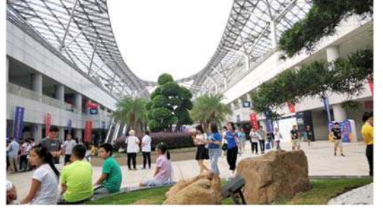
आंतरराष्ट्रीय संमेलन स्थळ

आम्ही कास्टिक स्पर्धेत सहभागी होऊ लागलो तेव्हा मोजक्याच देशांचे प्रतिनिधी स्पर्धेत सहभागी होण्यासाठी येत असत. २००७ साली केवळ ९ देशांचे प्रतिनिधी होते. दरवर्षी या संखेत भर पडत गेली. २०१८ सालच्या स्पर्धेत एकूण ५० देश सहभागी झाले होते. स्पर्धकांची संख्या सुमारे ३०० एवढी होती. या सर्वांची एका मोठ्या हॉटेलात राहण्याची सोय केली होती. त्याचबरोबर स्पर्धेचे आयोजन एका महाकाय अशा आंतरराष्ट्रीय संमेलन संकुलात (International Convention Centre) केले होते. त्या ठिकाणी मोठमोठी दालने होती. या दालनात सर्व विद्यार्थ्यांनी आपापले प्रकल्प लावले.