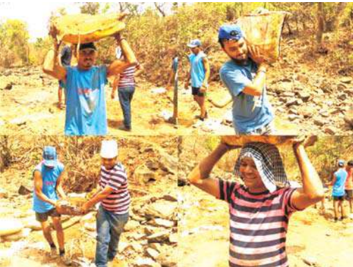
स्थळ- टाकीपठार येथील ओहळ

वनराई बंधारा बांधण्यात वापरण्यात आलेल्या मातीने भरलेल्या पिशव्या योग्य उंच ठिकाणी स्थानांतरित करणे आवश्यक असते. याद्वारे वनराई बंधान्यात वापरलेली माती वाया जात नाही. पावसाळा संपल्यानंतर याच मातीचा पुन्हा वापर केला जातो. यामुळे मृदेचे संवर्धन आणि वेळेची बचत होते.